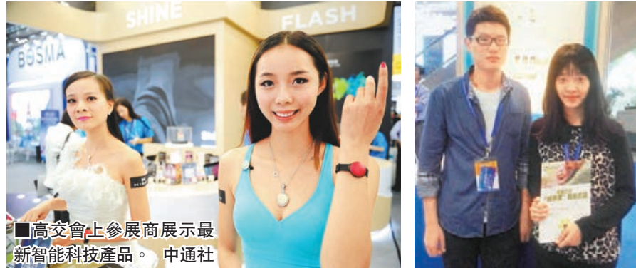
日前在深圳開幕的高交會現場。