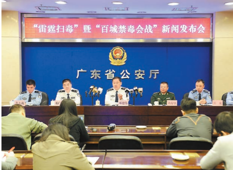
鄧建偉在記者會上告誡港台毒梟，廣東警方已盯緊跨境販毒情況，一有機會便可將其一網打盡。本報廣州傳真

香港文匯報訊(記者 敖敏輝 廣州報道) 港台毒梟操縱大宗跨境販毒活動猖獗。深圳警方近日在龍崗抓獲港籍毒梟在深6名「馬仔」，當場繳獲415.9公斤冰毒，創下廣東警方今年單個案件繳獲毒品數量之最。新上任的廣東省公安廳禁毒局局長鄧建偉表示，廣東警方已基本盯緊參與跨境販毒的港台毒梟，一有機會便可一網打盡，告誡他們「勿伸手」。