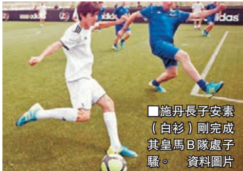
施丹長子安素(白衫)剛完成其皇馬B隊處子騷。