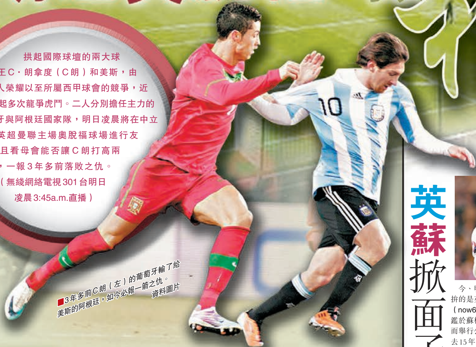
3年多前C朗(左)的葡萄牙輸了給美斯的阿根廷，如今必報一箭之仇。

拱起國際球壇的兩大球王C·朗拿度(C朗)和美斯，由個人榮耀以至所屬西甲球會的競爭，近年掀起多次龍爭虎鬥。二人分別擔任主力的葡萄牙與阿根廷國家隊，明日凌晨將在中立場、英超曼聯主場奧脫福球場進行友賽，且看母會能否讓C朗打高兩班，一報3年多前落敗之仇。(無線網絡電視301台明日凌晨3:45a.m.直播)