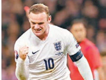
朗尼明晨將作「英倫式內訌」。