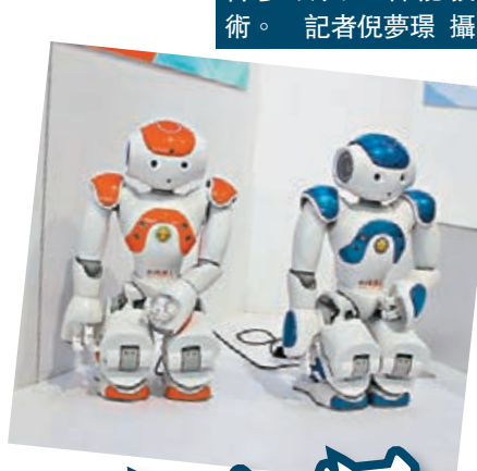
小i機械人的內芯融合多項人工智能技術。