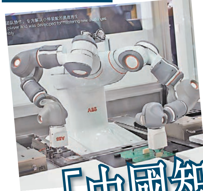
YuMi 雙臂機械人正在進行小件裝配工作。