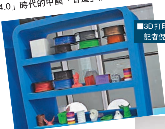
3D打印成品。

香港文匯報訊(記者倪夢環、實習記者穆潤 上海報道) 隨着科技的發展、以及勞動力成本的提高，人機協作、或以機械人取代人手已成為工業生產的趨勢；3D打印機的出現，讓「生產到成品」的程序大為簡化；而智能手機的技術，大大改善人們的生活。月初在上海舉行的第十六屆中國國際工業博覽會，在中國製造業轉型之際，展現「工業4.0」時代的中國「智造」能力。