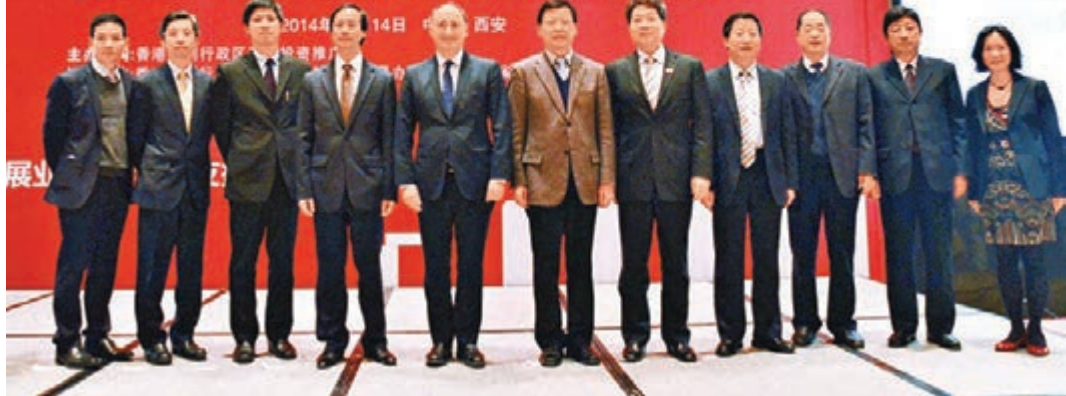
參加投資推廣研討會的嘉賓合影留念。