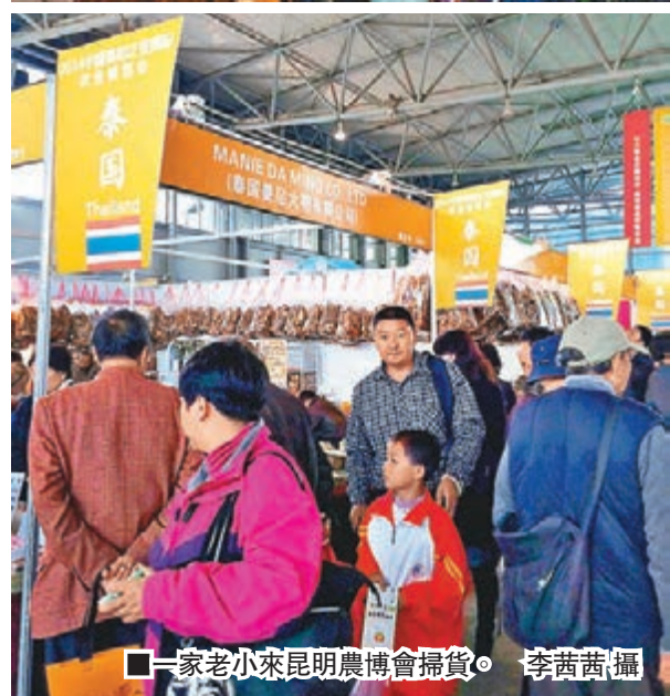
一家老小來昆明農博會掃貨。