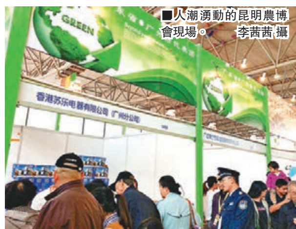
人潮湧動的昆明農博會現場。

農博會開幕期間還同時舉行了雲南高原特色農產品產銷對接會、特邀客商座談會、「花開高原，美在雲南」為主題的花藝比賽、插花作品展示和美食品鑒等活動。中國農產品市場協會將組織內地200多家農產品批發市場、大型連鎖超市以及境外的農產品採購商等相關企業客商進行採購和洽談，全力打造高原特色農產品採購交易平台和經貿合作平台。