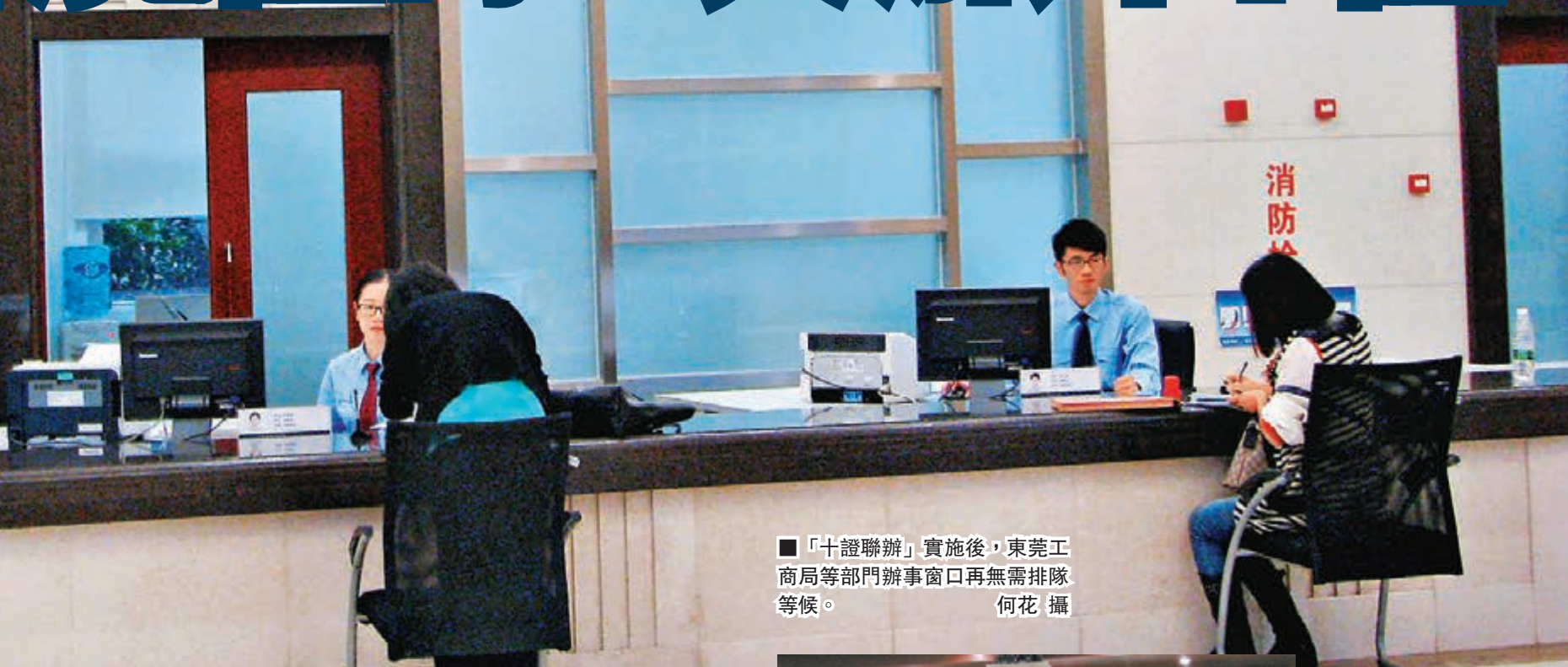
「十證聯辦」實施後，東莞工商局等部門辦事窗口再無需排隊等候。

香港文匯報訊（記者何花 東莞報導）近日，《東莞市外商投資企業網上多證聯辦實施辦法》正式施行，在內地率先推行外商投資「十證聯辦」改革。記者在該項新政正式實施的新聞發佈會上了解到，新設外資企業可在網上提交一次材料即辦齊10個證照，提供材料數量較以往銳減53%，所需辦理時間亦從半年左右，縮至3個工作日。港資企業成為了受惠於這項措施的一群，在首批申領的企業中，7家港資企業在3天內辦妥全部註冊。