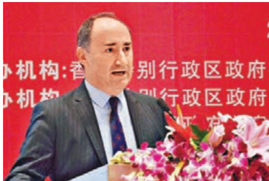
香港投資推廣署署長賈沛年介紹香港優勢。

香港文匯報訊（記者張仕珍、實習記者王明楊 西安報導）香港投資推廣署14日在陝西西安舉辦「善用香港優勢·開拓海外市場」投資推廣研討會，多位行業專家匯聚西安，鼓勵陝企充分利用香港的營商優勢以及國家推動企業走出去的機遇，以香港為平台，開拓國際市場。