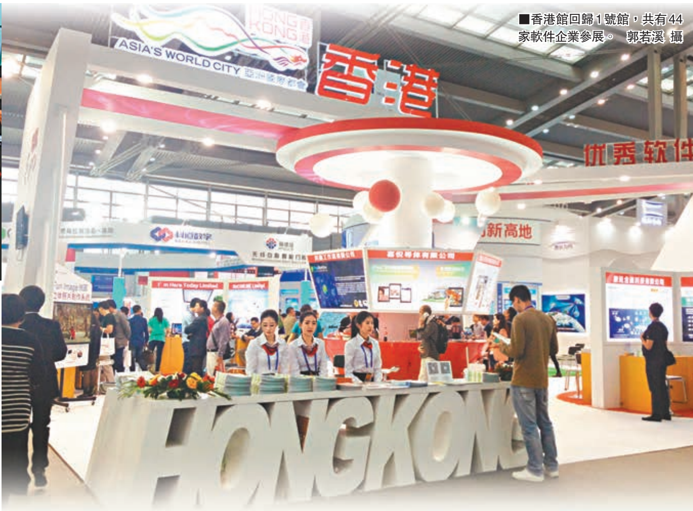
■香港館回歸1號館,共有44家軟件企業參展。

深圳高交會有「中國科技第一展」之稱,是中國高新技術領域對外開放的重要窗口和高新技術成果交易的重要平台。本屆展會中國科技部舉辦「國家科學技術獎獲獎成果和最新技術展」,將展出探月工程約200個項目及實物;中科院專館帶來北斗應用技術研究院等數十家機構的300多個參展項目;中國工程院舉辦「2014戰略性新興產業培育與發展論壇」,發佈七大戰略性新興產業最新研究成果。此外,隨着中國成為對外投資大國,不但新興市場,就連歐美等發達國家也眼盯着中國,力圖吸引更多的中國投資。今屆展會吸引了500多家來自澳洲、美國、德國、加拿大、法國等20個國家和地區的企業參展,其中包括Honeywell、Brother等名企。