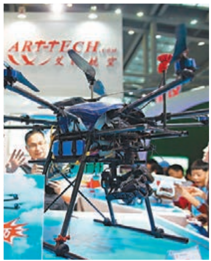
■價值180萬的無人機可飛至3000米高度。