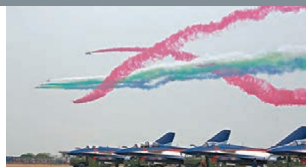
■珠海航展飛行表演精彩紛呈。