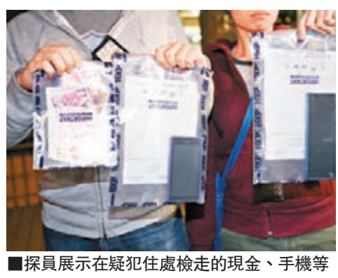
探員展示在疑犯住處檢走的現金、手機等證物。

有人遂藉此作惡，先與受害少年示好，並答應願成為小情侶，其間不斷向對方勒索錢財及免費吃喝玩樂。其後再表示已另結有幫派背景新歡，並受對方要脅勒索，要求少年代為籌錢。