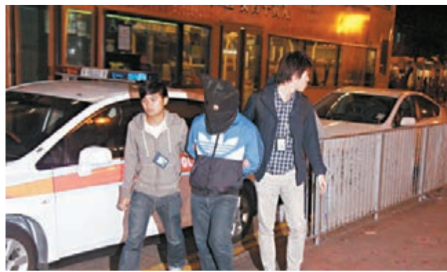
涉恐嚇勒索的疑犯被押返橫頭磡警署所搜查。

香港文匯報訊(記者 鄺福強 杜法祖) 天水圍揭發「黑底」情侶合謀欺少年事件。14歲少年誤交17歲不良少女，以為兩小無猜，豈料對方迅即變臉，未幾即報稱另結有黑社會背景新歡，日前少年擬「籠袋」不遂，反遭對方以黑社會語句恐嚇，強取去其約4,500元現金及手機。元朗警區重案組接手經追查後，將涉案情侶拘捕，昨晚將疑人押返黃大仙住所搜查，檢走一批證物，涉案男女遭通宵查。