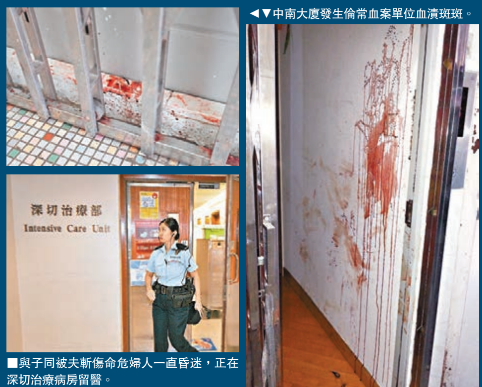
與子同被夫斬傷命危婦人一直昏迷，正在深切治療病房留醫。

另一目擊者陳先生稱，疑兇的妻子亦滿身鮮血，從後追趕阻止疑兇追斬兒子時，以普通話高喊「阻止他，阻止他」，當時場面非常恐怖。