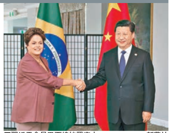
■習近平會見巴西總統羅塞夫。

全面戰略夥伴關係的倡議以及中方採取的切實措施。巴方希望加強雙方油氣、新能源、衛星、信息技術等領域合作，歡迎中方參與巴方高鐵建設，希望盡快成立「兩洋鐵路」工作組，啟動相關工作。巴方願積極推動拉中合作。