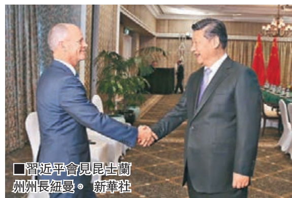
■習近平會見昆士蘭州州長紐曼。

香港文匯報訊 國家主席習近平昨日在布里斯班會見澳洲昆士蘭州州長紐曼。習近平表示，中方鼓勵更多中國企業參與昆士蘭州能源礦產、農牧業開發、基礎設施建設。