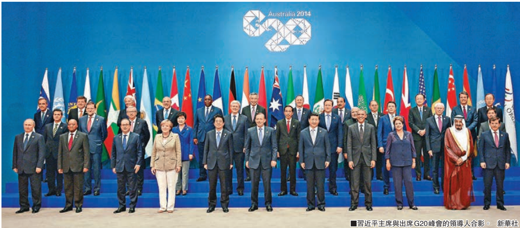
■習近平主席與出席G20峰會的領導人合影。

會議宣布，中國主辦2016年二十國集團領導人峰會。習近平表示，中方有信心當好2016年主席國及2015、2017年「三駕馬車」成員，同各方一起把二十國集團機制維護好、建設好、發展好。