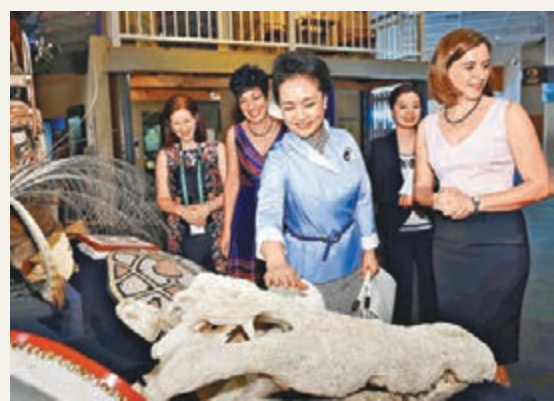
■彭麗媛參觀昆士蘭州博物館。

彭麗媛昨日在昆士蘭州州長紐曼夫人利薩陪同下參觀昆士蘭州博物館。彭麗媛聽取了當地民俗文化、自然風貌、生物多樣性介紹，觀看了原住民文物、珍奇動物標本和海洋展廳，希望兩國加強人文交流，增進人民友誼。