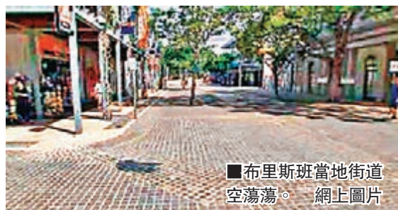
■布里斯班當地街道空蕩蕩。

G20峰會組織者預計，峰會期間將有至少4,000名代表以及3,000餘名媒體記者湧入布里斯班。為了