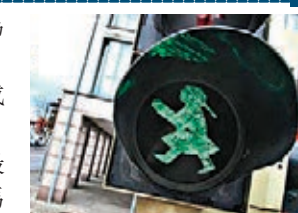
■部分德國城市已有使用女仔圖像做紅綠燈。