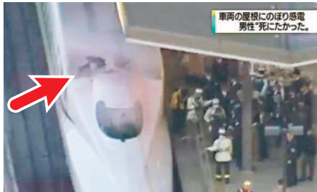
■列車留下一片焦黑(箭咀)。網上圖片