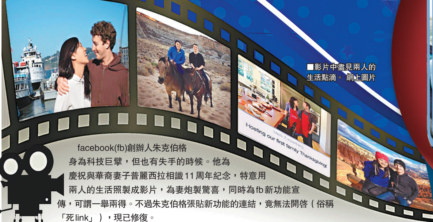
■影片中盡見兩人的生活點滴。

facebook(fb)創辦人朱克伯格身為科技巨擘，但也有失手的時候。他為慶祝與華裔妻子普麗西拉相識11周年紀念，特意用兩人的生活照製成影片，為妻炮製驚喜，同時為fb新功能宣傳，可謂一舉兩得。不過朱克伯格張貼新功能的連結，竟無法開啓(俗稱「死link」)，現已修復。