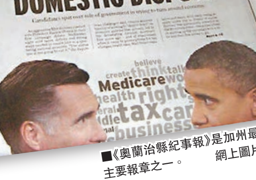
■《奧蘭治縣紀事報》是加州最網上圖片 主要報章之一。