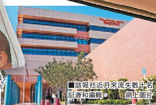
■該報社近月來流失數十名記者和編輯。網上圖片

隨着社交網絡和網上媒體興起，報紙和雜誌等印刷媒體經營愈趨艱難。在美國加州，有報社更要求包括記者等全體僱員，在星期日幫忙派報、打電話給客戶等，以節省成本。報社主編柯利坦言目前報社處境艱難，但強調是否派報是員工自願，並指這只是臨時舉措，旨在維持派報服務，代表公司「忠於讀者」。