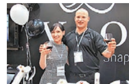
Viora 於香港亞太美容展會上發佈其可替換治療手柄的 V-系列產品。

醫學美容設備供應商 Viora 於香港亞太美容展會上發佈其 V-系列新品。V- (V30, V20, V10) 皮膚治療與皮膚美容平台擁有激光、脈衝光及射頻等專利技術，使美容從業者有能力開展受歡迎美容項目。