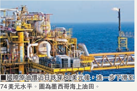
國際原油價近日跌穿80美元後，進一步下瀉至74美元水平。圖為墨西哥海上油田。

美元轉強，供過於求，國際油價下挫，布蘭特原油報價跌破100美元，不僅讓能源商品風向標的標普GSCI能源指數第四季起跌了12.54%，標普500能源板塊同期也跌了7.16%；然而投資者倘若憧憬產油國原油減產以及全球能源消耗量增長，有望讓超跌的能源板塊回升，將成為市場的關注點，不妨留意局收集建倉。