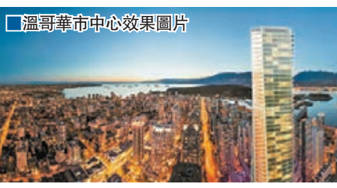
溫哥華市中心效果圖片

美聯物業(環球)有限公司「簡稱美聯(環球)」獲委託銷售加拿大西部溫哥華市中心矚目物業 Trump International Hotel & Tower Vancouver，這幢摩天大廈由當地發展商 Holborn 及 Ta Global 精心發展，除提供酒店房間外，更提供約218個住宅單位，將成為溫哥華的全新地標。項目將於本周末11月15日(周六)及16日(周日)假座香港銅鑼灣怡東酒店舉行，是次推售的單位訂價由港幣約500餘萬元起。