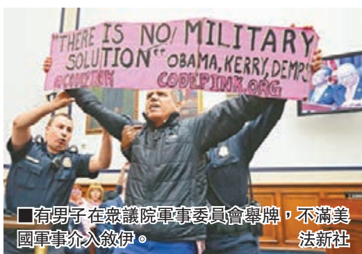
有男子在眾議院軍事委員會舉牌，不滿美軍軍事介入敘伊。

軍事委員會表示，由於伊拉克政府軍與ISIL力量懸殊，建議考慮除協助訓練的軍事人員外，派遣地面部隊參與伊拉克軍對抗ISIL任務。