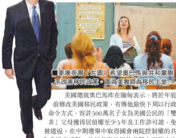
麥康奈爾(左圖)希望奧巴馬與共和黨聯手改善移民政策。圖為美教師為移民上堂。

美國總統奧巴馬昨日在緬甸表示，將於年底前修改美國移民政策，有傳他最快下周以行政命令方式，容許500萬名子女為美國公民的「雙非」父母獲得居留權至少5年及工作許可證，免被遣返。在中期選舉中取得國會兩院控制權的共和黨揚言反對，並指若奧巴馬執意單方面修改法