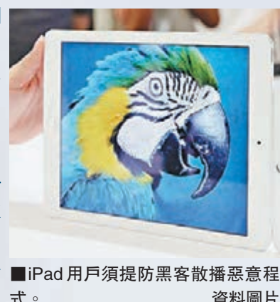
iPad用戶須提防黑客散播惡意程式。資料圖片

美國國家網路安全暨通訊整合中心與美國電腦緊急狀況應變小組指，iOS用戶若只從蘋果官方App Store下載應用程式，便可免受攻擊。用戶不應打開來歷不明的程式安裝連結，如iOS指明程式來自「不可信程式開發商」，用戶應點選「不信任」，並立即移除程式。FireEye日前發布這項漏洞詳情，指黑客以問題簡訊、電郵和網頁連結，誘騙使用者安裝惡意應用程式，取代透過蘋果安裝的電郵和銀行程式。FireEye把這手法形容為「假面攻擊」。【路透社