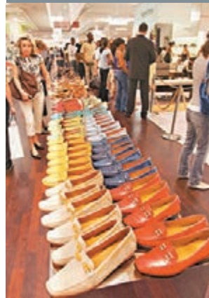
法國經濟增長0.3%。資料圖片

歐盟統計局昨公布歐元區第三季經濟按季增長0.2%，稍高於前一季的0.1%，按年增幅維持0.8%不變，較市場預期的0.7%高。最大經濟體德國期內回復增長0.1%，符合預期，避過陷入技術性衰退；第二大經濟體法國則增長0.3%，高過市場預期的0.2%，同樣避過衰退。