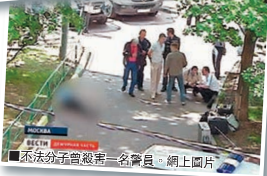
不法分子曾殺害一名警員。