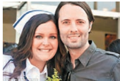
皮科(右)的妻子(左)難產。