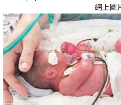
皮科的兒子最後仍不幸夭折。網上圖片