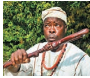
庫雍聲稱伊波拉是來自先人的懲罰。網上圖片

國際社會致力協助西非各國抗擊伊波拉疫情，利比里亞一名獲政府委派醫治伊波拉的巫醫，卻聲稱伊波拉是祖先對後裔的懲罰，揚言只有煙葉及祈禱可拯救民眾免受感染，又批評西方醫學成效不如非洲巫術。聯合國及其他國際組織抨擊這些巫醫阻礙診症，令疫情進一步擴散。