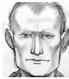
警方發布其中一名疑兇的掃描照。

俄羅斯首都莫斯科近日出現一個模仿犯罪暴力電子遊戲《俠盜獵車手》(GTA)的犯罪集團，他們在路面放置金屬釘，刺破行經車輛輪胎，迫使司機下車後開槍射殺，至今已殺害15人。總統普京非常關注，形容是恐怖主義事件，下令警方聯同俄羅斯聯邦安全局(FSB)展開緝捕，盡快破案。