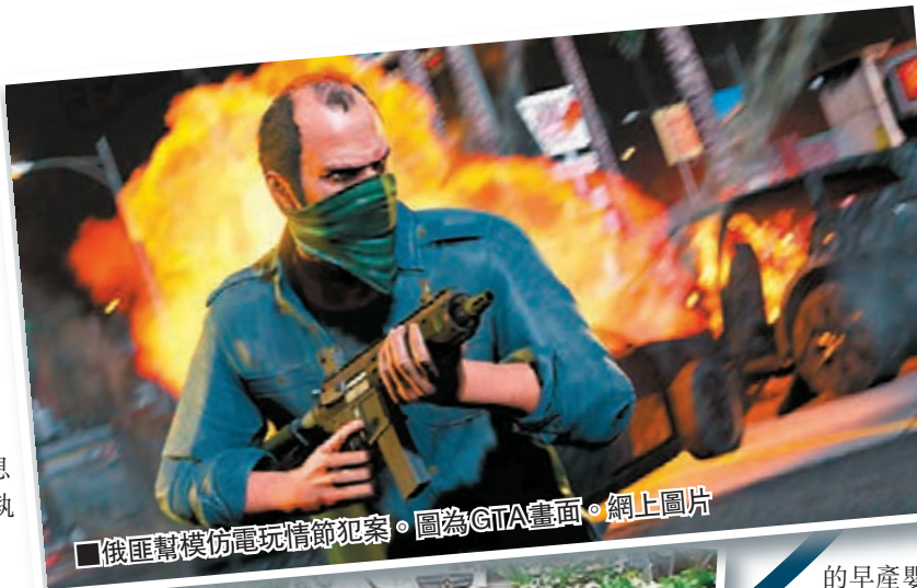
俄匪幫模仿電玩情節犯案。圖為GTA畫面。

jaamat的身份及行兇動機至今依然成謎，執法部門稱，一名頭目試圖用榴彈襲擊警員時被擊斃，但匪幫仍未瓦解，呼籲民眾保持警覺。一批志願者已組織糾察隊，在莫斯科附近道路巡邏，嘗試追捕疑兇。