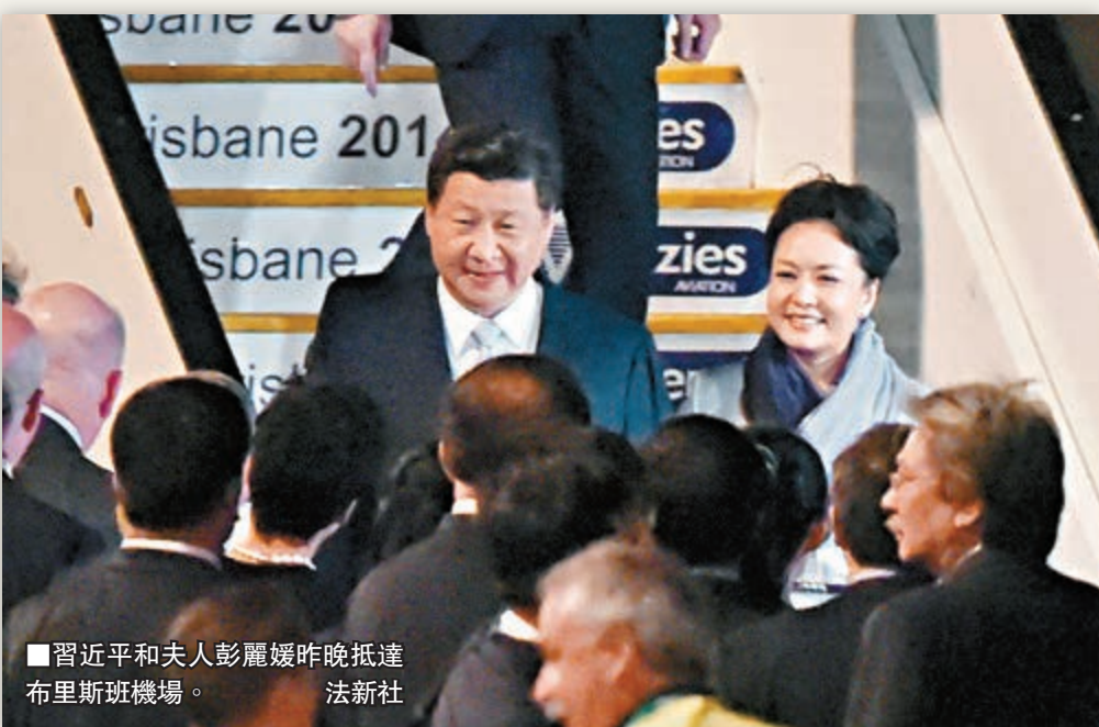
習近平和夫人彭麗媛昨晚抵達布里斯班機場。