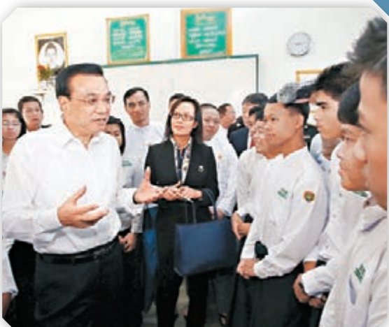
李克強與緬甸青少年交流。

李克強還勉勵他們更好地傳承中緬「胞波」友誼，讓中緬友好事業後繼有人。李克強說，中國政府明年將邀請100名緬甸青年赴中國訪問，還將增加對緬甸政府獎學金名額，給緬甸學生赴華留學創造更多機會。