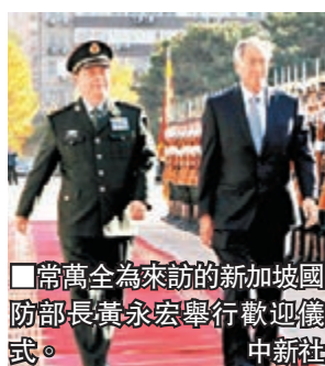
常萬全為來訪的新加坡國防部長黃永宏舉行歡迎儀式。

香港文匯報訊 中國國務委員兼國防部長常萬全昨日在北京與來訪的新加坡國防部長黃永宏舉行會談，雙方一致同意，共同致力於通過四點共識加強雙邊防務合作。