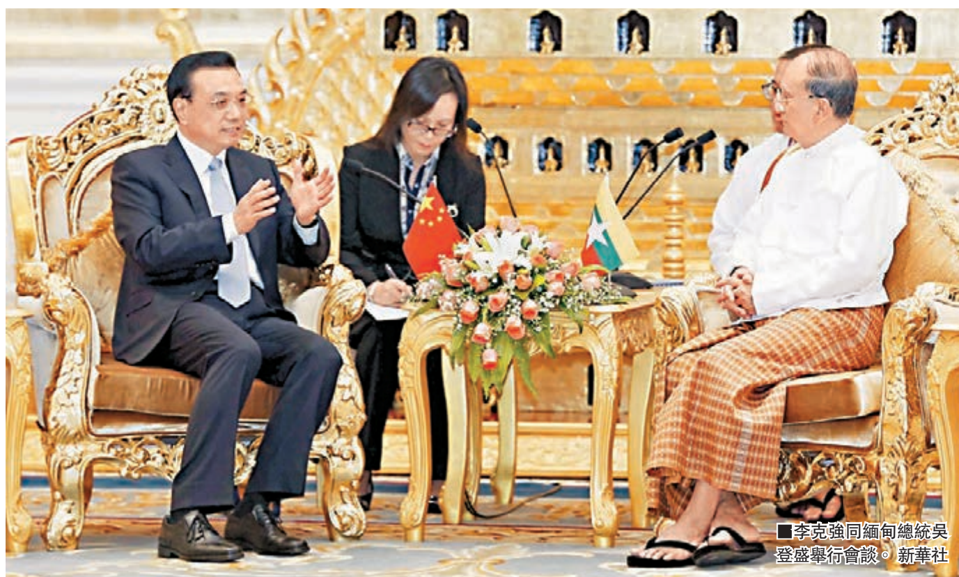
李克強同緬甸總統吳登盛舉行會談。

香港文匯報訊 中國國務院總理李克強昨日在內比都和緬甸總統吳登盛舉行雙邊會談。雙方見證簽署經貿、農業、金融、能源等領域20多個中緬合作文件，累計80億美元(約620億港元)，其中包括中方將向緬甸提供2億美元(約16億港元)小額扶貧貸款，進口10萬噸當地大米。