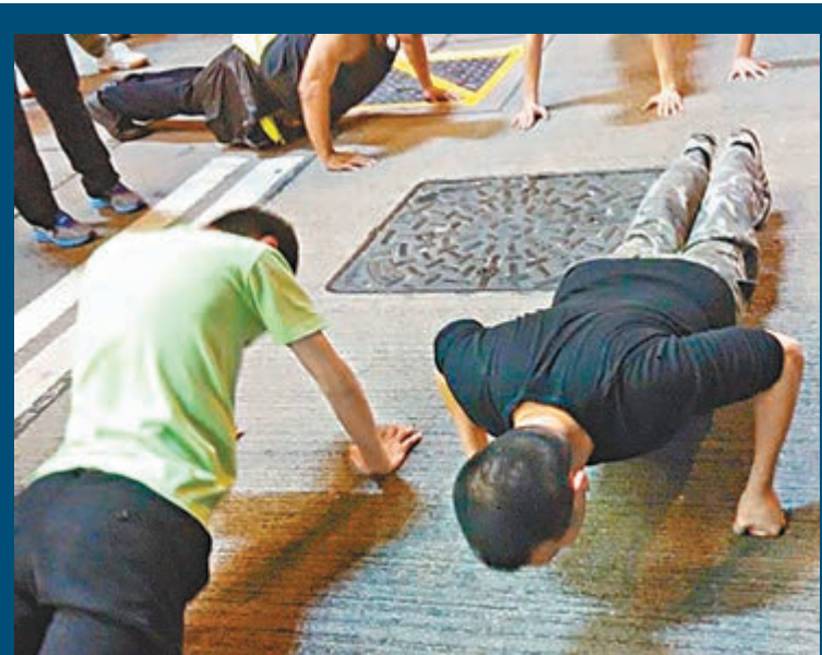
■在旺角「佔領」區，不少示威者每晚都會「圍練」，似是為抗拒清障作準備。