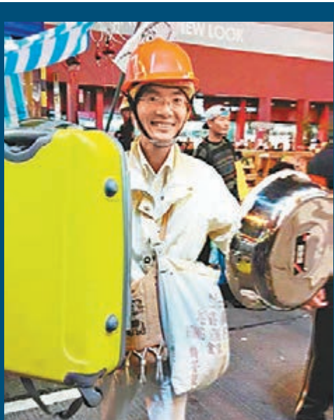
■在旺角「佔領」區，有示威者「全副武裝」圍抗拒清障。