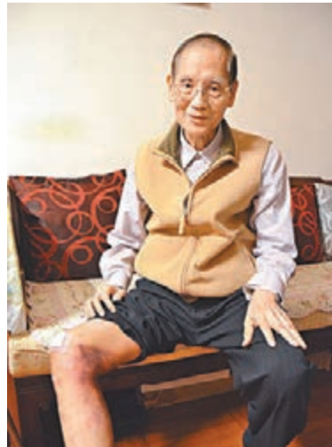
■81歲的趙伯伯因「佔領」阻路，雖尾龍骨及大腿受傷，仍要徒步15分鐘往診所就醫。

香港文匯報訊 (記者 文森) 「佔領」行動持續堵塞香港主要幹道。儘管法院已頒下臨時禁制令，但「佔領」者拒絕清除堵路的障礙物，令各區交通持續擠塞，尤其港島區情況最嚴重。昨日，被非法佔據的道路總長度為2.2公里，令港島北岸在繁忙時間出現嚴重阻塞，中區至銅鑼灣的行程時間較以往增加一至兩倍。一名八旬老翁昨日向本報投訴，由於的士行程因「佔領」者堵塞道路而受阻，由薄扶林至銅鑼灣就需要逾1小時，令行動不便的他要徒步15分鐘前往診所，慘成「佔領」行動的受害者。