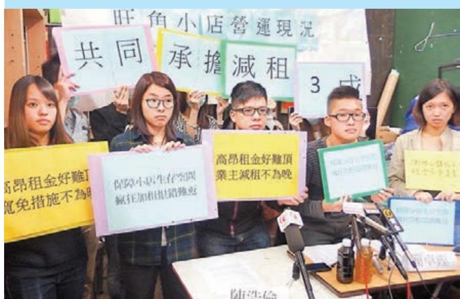
旺角小店關注組調查發現，超過40%在旺角佔領地區附近的受訪商戶生意額下跌超過50%。

服務輸出在第三季恢復增長，按年實質上升2.0%，扭轉第二季2.0%的跌勢。旅遊服務輸出所造成的拖累顯著減輕，按年僅微跌0.8%，與上一季的雙位數跌幅形成鮮明對比，這一方面是由於基數效應逐漸減退，另一方面也受惠於訪港旅客人數回復雙位數增長。運輸服務輸出依然偏弱，按年僅微增長，部分原因是受貨運疲弱所拖累。經季節性調整後比較，服務輸出在第三季明顯反彈，較上一季實質回升1.3%。