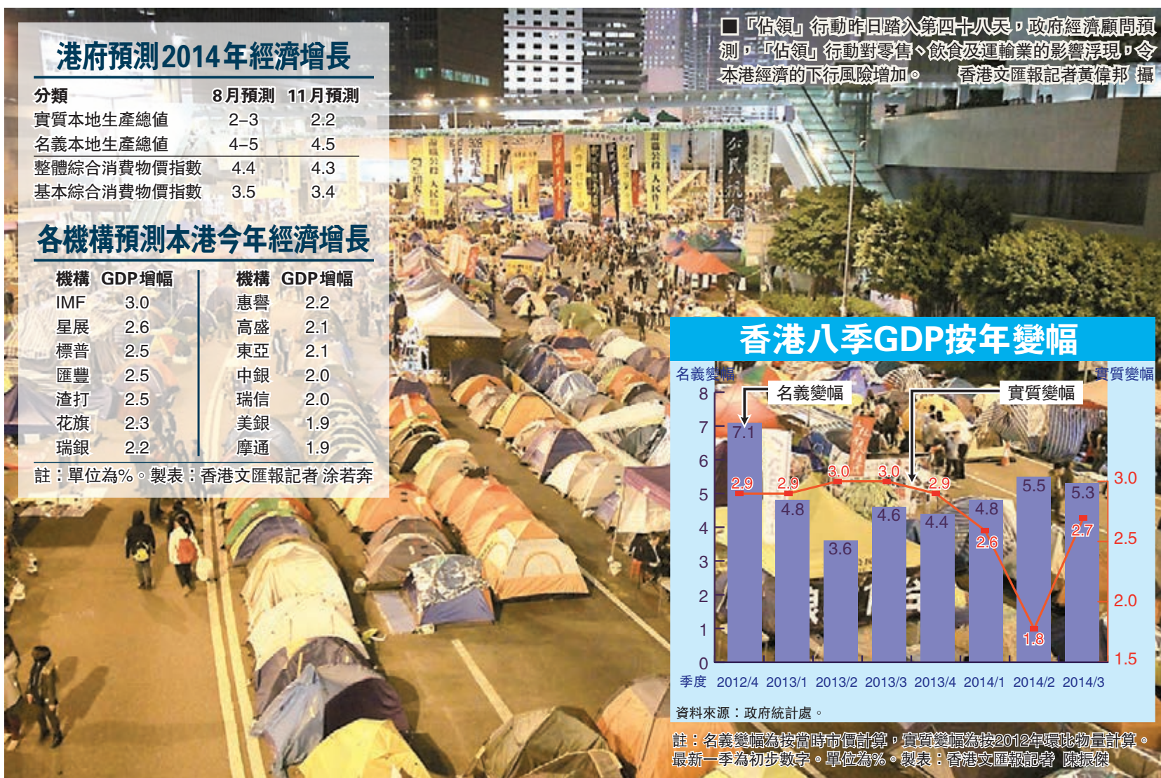
「佔領」行動昨日踏入第四十八天，政府經濟顧問預測，「佔領」行動對零售、飲食及運輸業的影響浮現，令本港經濟的下行風險增加。