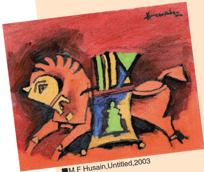
■ M F Husain, Untitled, 2003

Ghose：印度是一個語言和宗教多元的國家，其藝術自然多元化。最重要的是即使如此，印度藝術無論如何多元，對於印度社會和文化上的價值都是一致的。