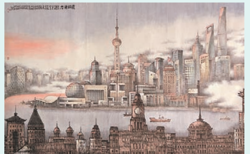
■「上海風貌」板塊以陸家嘴象徵上海的今天。

用幾年時間創作一幅畫，但現在有些畫家一天就能畫十幅，質量怎可同日而語？」他直言，有藝術追求的畫家，應該少一點追名逐利，多幾分靜心沉思，才能不斷精進。除了雙休日返家，其餘時間沈向然都「隱居」於遠離上海市區的青浦工作室，躲避俗事之擾，潛心繪畫創作與研究。他推崇王維的「半隱半官」，並將自己的生活狀態戲稱為「半隱半露面」，「藝術家應當既遊走於時代，又不為之所左右。」