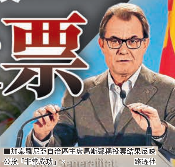
加泰羅尼亞自治區主席馬斯聲稱投票結果反映公投「非常成功」。

西班牙加泰羅尼亞昨日舉行沒約束力的獨立公投，點票結果顯示，當中逾80%支持獨立、脫離西班牙統治。不過西班牙憲法法院早已裁定公投違憲，故僅具象徵意義，加上多個反獨立政黨號召杯葛公投，逾半合資格選民沒投票。報道指，這反映他們不贊成獨立，或認為公投欠缺合法性。