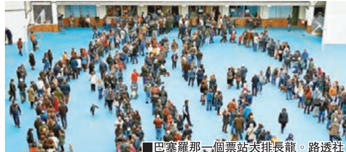
巴塞羅那一個票站大排長龍。