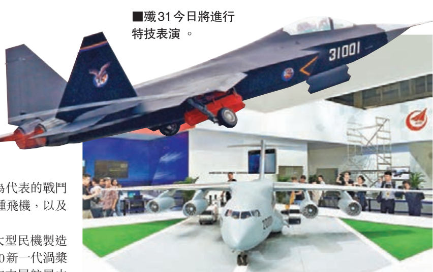
殲31今日將進行特技表演。

飛行表演是航展中最受歡迎的環節。值得關注的, 殲31戰機和大型運輸機將於今日上午進行單機特技表演。評論認為, 使用最先進甚至研機型進行特技表演, 不僅考驗駕駛者的能力, 更顯示出中航工業對產品的高度自信。此外, 本屆航展將有來自3