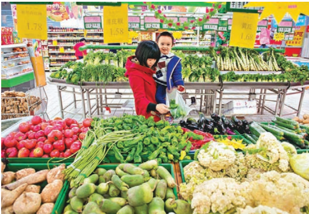
10月份全國居民消費價格指數同比上漲1.6%, 漲幅與上月持平。圖為安徽合肥市市民在超市選購蔬菜。

近日央行發佈的第三季度貨幣政策執行報告披露, 於9月和10月兩次使用新創設的MLF(中期借貸便利)向商業銀行注入流動性, 未來將根據經濟基本變化適時適度預調微調, 為經濟結構調整與轉型升級營造「中性適度」的貨幣金融環境。首創證券估計, 央行兩次MLF的操作, 已釋放近8,000億元人民幣的流動性, 相當於下調存款準備金率0.6-0.7個百分點。