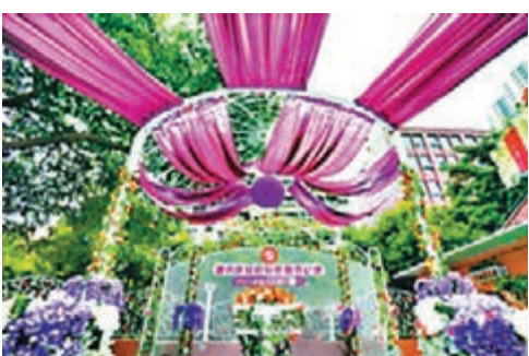
首個常設結婚登記戶外頒證廳設計具歐陸風情。

據了解, 越秀區婚姻登記處是全省首個設在公園內的婚姻登記處, 開張相隔僅兩三個月, 又推出戶外頒證廳。據負責人介紹, 為順應民眾要求, 提供更為個性、溫馨的婚登服務, 戶外頒證廳曾向民眾徵集設計方案, 多數民眾建議以「歐陸風情」為主, 由於考慮到建築材料耐用性要好, 目前主要採用了鐵藝、幹花(假花)、塑膠等可循環再用建材為主的設計方案, 經過2個多月的裝修、佈置, 耗資近10萬元, 最後裝飾出以白、紫、粉、金為主色調, 歐陸婚慶情景為主題的戶外頒證廳。 越秀區婚姻登記處負責人表示, 由於是首個常設戶外頒證廳, 需要一段試運行時間, 按照以往工作經驗及目前人力情況設定每天