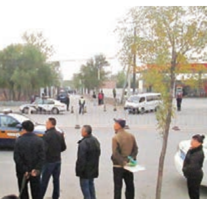
昨日爆炸現場被戒嚴。

香港文匯報訊(記者 田一涵 北京報道) 昨日, 網傳北京市豐台區世界公園附近的一個加油站旁發生爆炸, 有圍觀民眾稱, 一個男童在無意中引爆了一個爆炸裝置後被炸身亡。記者趕到事發現場發現, 現場周邊已被戒嚴, 警察利用警犬搜索。有消息稱, 又在附近發現數枚爆炸物, 現已被成功清除。截至記者截稿時, 北京官方尚無證實或發佈相關信息。 事發現場位於北京市豐台區葆台路沿線的一個加油站旁, 加油站以南是一個傢具城。一圍觀民眾稱, 事故發生在昨日中午時分, 她聽到一聲巨響, 幾分鐘後, 大量的警車湧入傢具城與加油站之間的小巷, 道路被戒嚴。有警犬被牽進去, 又