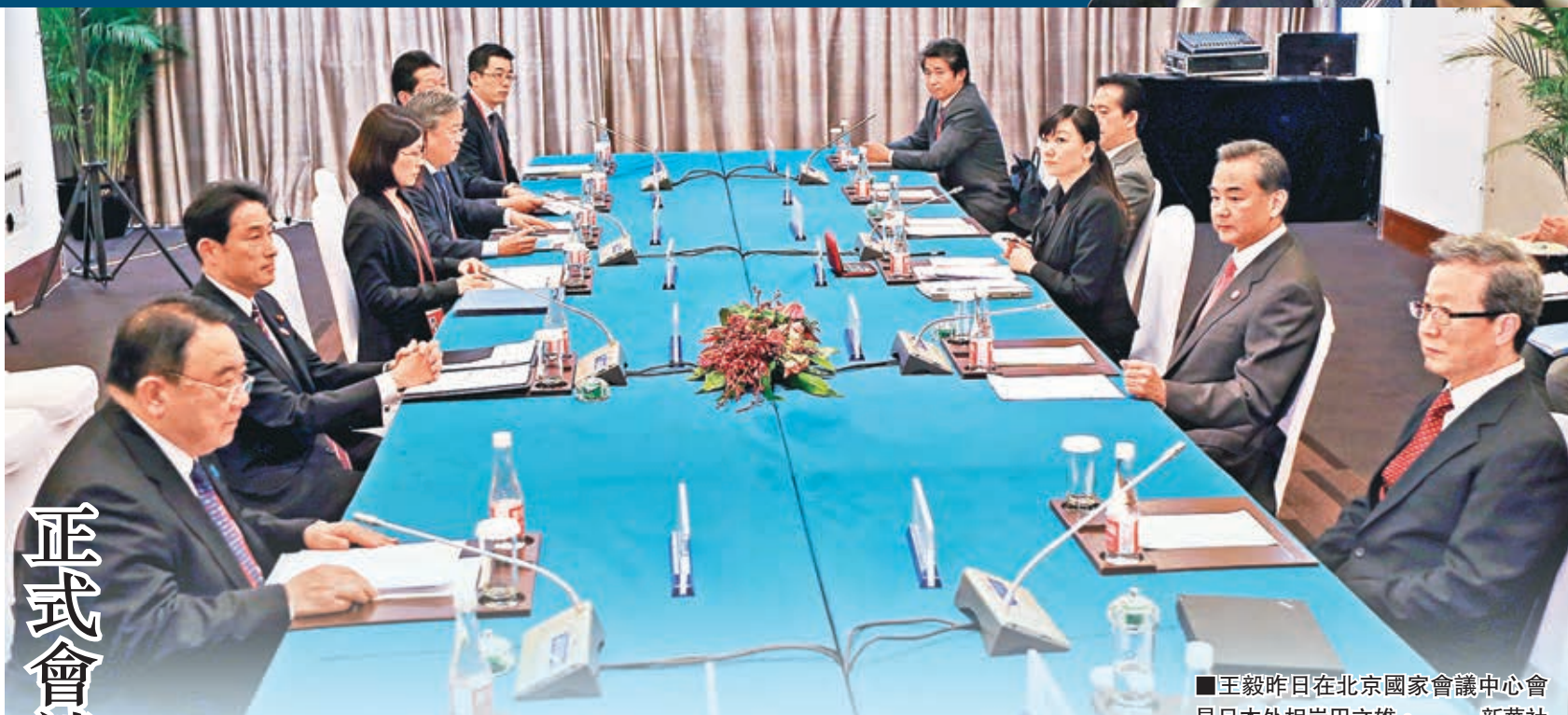
王毅昨日在北京國家會議中心會見日本外相岸田文雄。

高虎城表示，近年來中日關係由於眾所周知的原因陷入嚴重困難局面，雙方的經貿合作也受到一定影響。中國一貫高度重視並積極致力於發展中日睦鄰友好合作關係。中日經貿合作發展到當前規模，是兩國政府和經濟界長期共同努力的結果，值得雙方共同珍惜。希望日方用實際行動為改善兩國關係作出努力。高虎城重申，吸收外資是中國對外開放基本國策的重要內容，中國政府歡迎包括日本在內的各國投資者來華投資。