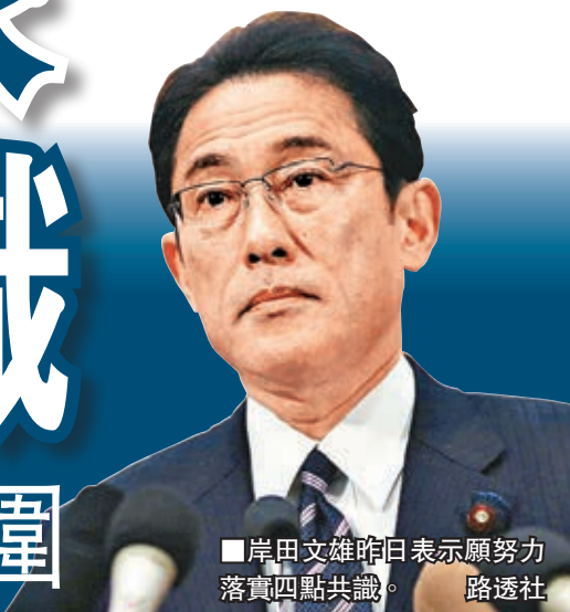
岸田文雄昨日表示願努力落實四點共識。

香港文匯報訊(記者馬靜北京報道)APEC中日元首能否會晤連日來備受媒體關注，日方頻頻為爭取會晤做出努力。中國外交部長王毅昨日下午在會見來華出席亞太經合組織部長級會議的日本外相岸田文雄時指出，當前最關鍵的是日方要認真對待中日關係四點原則共識。他又強調，日方應該與過去侵略行徑和理論一刀兩斷，徹底決裂，為兩國領導人習近平與安倍晉三的會面營造必要和好的氛圍。