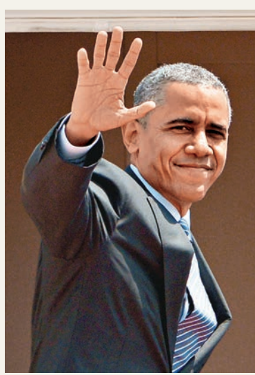
奧巴馬即將與習近平在北京會面。

對於是次「習奧會」，美國戰略與國際問題研究中心專家馬修·古德曼認為，經濟關係一直被稱為中美關係的「壓艙石」。兩國元首預計將在會談中進一步討論如何減少和管控貿易摩擦，擴大經濟合作。他說，「兩國在經濟增長方面有着諸多共同利益。」此外，「推進亞太自貿區(FTAAP)建設」被視為本次APEC會議的最優先議題。一位不具名的美國高級別貿易官員表示，亞太地區有多條通向自由貿易的路徑，FTAAP與美國力推的跨太平洋夥伴關係協定(TPP)並不矛盾。在美方看來，後者是實現前者的一塊「磚石」。