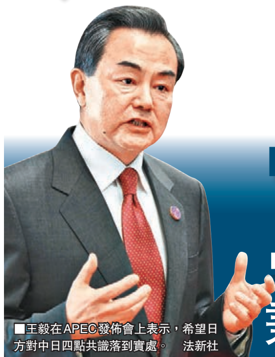
王毅在APEC發佈會上表示，希望日方對中日四點共識落到實處。