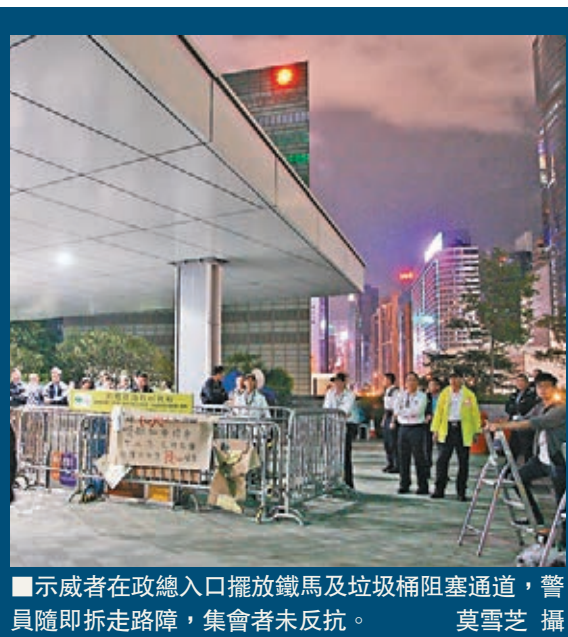
■示威者在政總入口擺放鐵馬及垃圾桶阻塞通道,警員隨即拆走路障,集會者未反抗。

一名年約30歲,駐守葵涌警署特遣隊的便衣警員,前日傍晚在返回葵涌警署上班途中,步至葵義路等候過馬路時,突被一名年約20歲至30歲、身高1.67至1.75米、瘦身材,戴黑框眼鏡,穿綠色外套及黑色長褲的男子上前揮拳襲擊,警員猝不及防,頭部連中數拳受傷倒地。