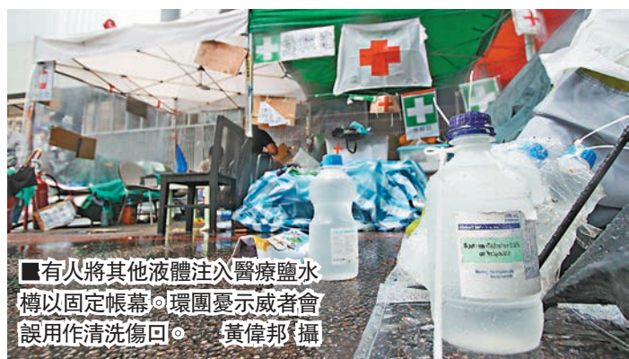
■有人將其他液體注入醫療鹽水樽以固定帳幕。環團憂示威者會誤用作清洗傷口。

香港文匯報訊(記者 文森)香港近日天氣潮濕,連日來都有幾陣雨,令本港「佔領區」內多處積水。有環保團體擔心,本港近日已確診多宗「登革熱」本地個案,而「佔領區」內人擠人,又未有進行大型清潔和消毒,會讓積水滋生蚊蟲,增加「佔領區」爆發「登革熱」等蚊蟲傳播疾病的風險。