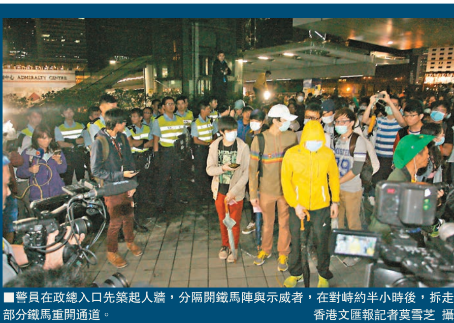
■警員在政總入口先築起人牆,分隔開鐵馬陣與示威者,在對峙約半小時後,拆走部分鐵馬重開通道。