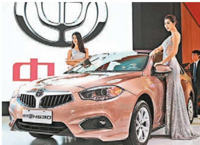
定位「寬適品質家轎」的中華新H530彰顯澎湃T動力與超大空間的創新特色。

金盃品牌全新閣瑞斯也將盛裝亮相。「大器商旅,通達天下」的金盃全新閣瑞斯,堪稱集「新外觀、新技術、新體驗」三位一體的大MPV,主體致力商務市場。