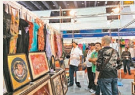
分析預測,義烏四季度外貿增速有望進一步走高。

香港文匯報訊(記者白林森義烏報道)據義烏海關最新統計,今年1月-9月,浙江義烏市實現外貿進出口總值突破1,000億元(人民幣,下同)大關,達1,078.3億元,同比增長19.3%。其中出口1,055.2億元,同比增長19.1%,進口23.1億元,同比增長32.5%。