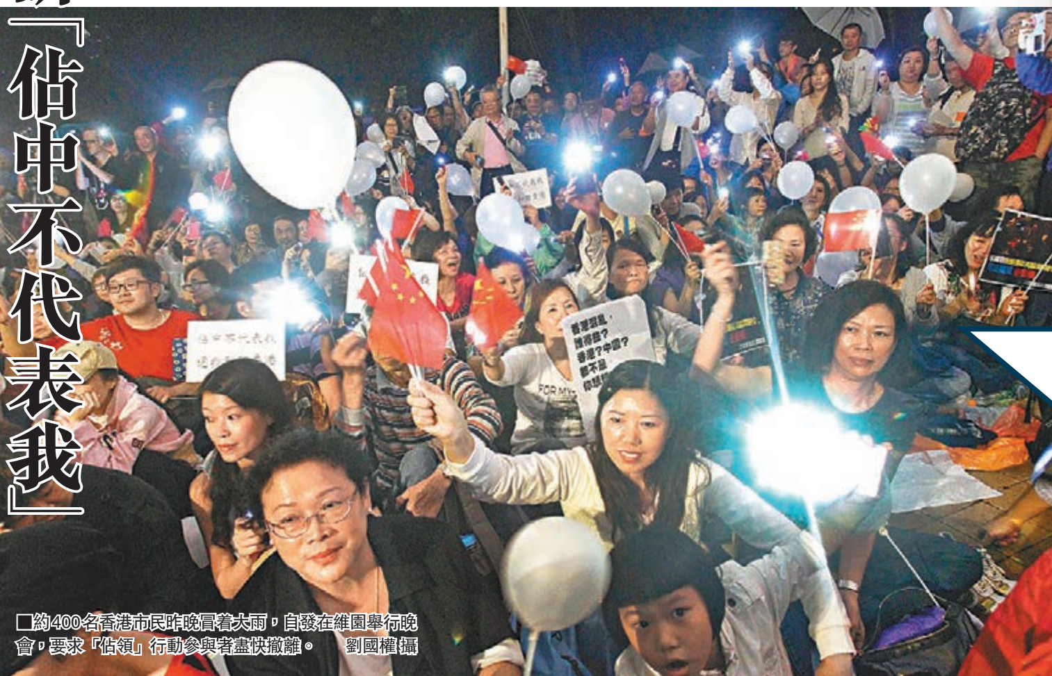
約400名香港市民昨晚冒雨，自發在維園舉行晚會，要求「佔領」行動參與者盡快撤離。

香港文匯報訊(記者 鄭治祖、文森)香港「佔領」行動持續逾40天，社會運作大受影響。約400名香港市民昨晚冒着大雨，自發在銅鑼灣維多利亞公園舉行晚會，要求「佔領」行動參與者盡快撤離，還路於民，並支持警方嚴正執法。