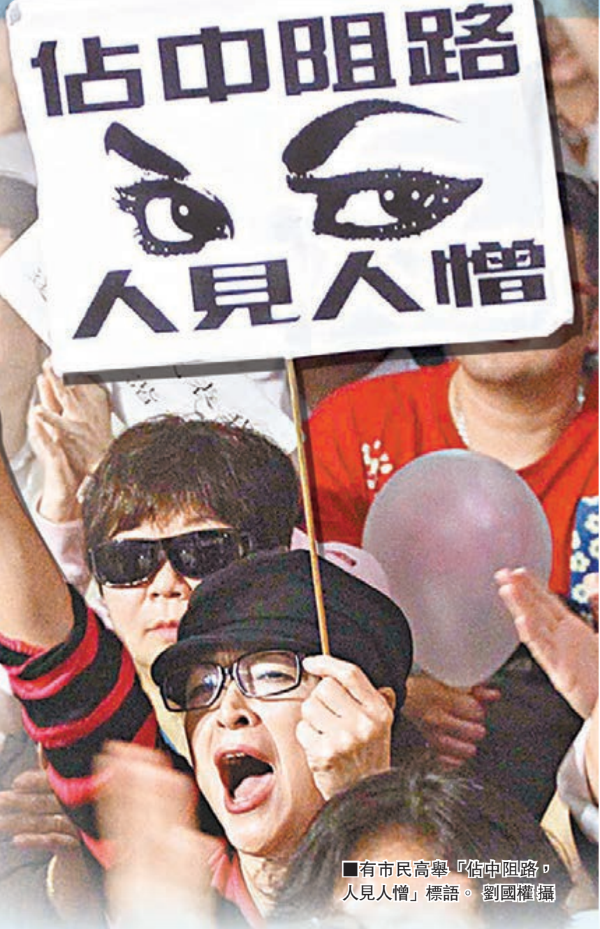
有市民高舉「佔中阻路，人見人憎」標語。

他又表示，現場安排了約50名糾察，有足夠人手維持秩序。而台上人員若發現在場集會人士情緒過於高漲，亦會呼籲他們冷靜，讓集會人士可理性表達意見。