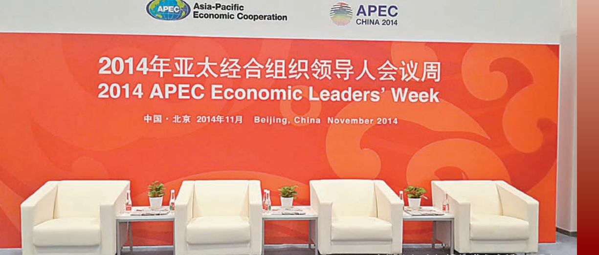
2014年亞太經合組織領導人會議周現場

近日，亞太經合組織(APEC)領導人會議周的最後一次高官會在北京舉行，拉開了今年APEC領導人會議周大幕。作為亞太地區最大的經濟合作組織，APEC能否促進務實合作謀求共同發展，可以通過此次會議得到答案。昆侖山作為中國高端水第一品牌，憑借高海拔、零污染的珍貴雪山礦泉水品質，再度成爲此次會議的指定用水，助力這場亞太區域最高規格的盛事。