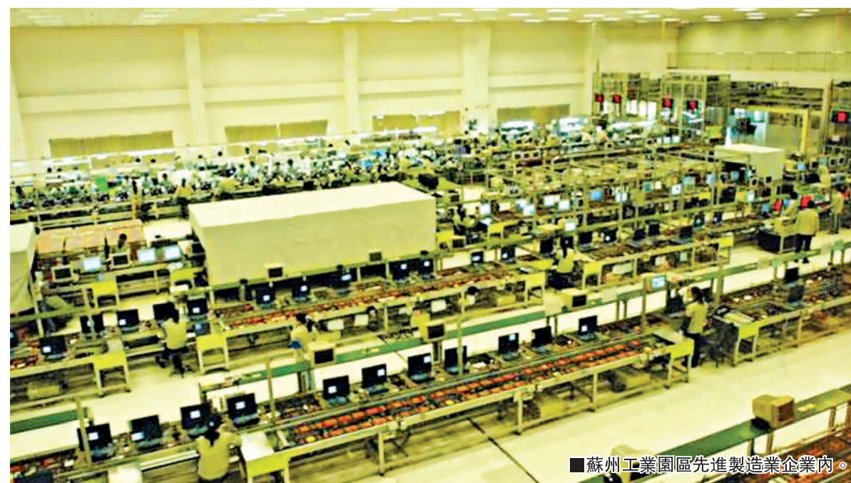
蘇州工業園區先進製造業企業內