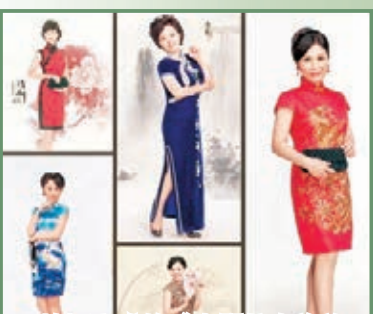
拍攝完成的《南開校友旗袍長卷》選。

身材等條件限制，均自願報名參加。目前，已有四百多人報名，拍攝工作正在進行中。據組織者介紹，長卷的全部拍攝製作工作將在明年春季完成。屆時，製作完成的百米長卷將作為一份厚禮贈給明年5月在津舉行的南開大學全球校友會會長論壇。