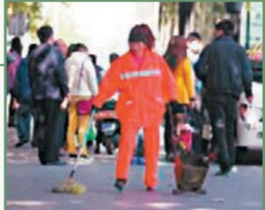
時髦的康芳在做保潔。網上圖片