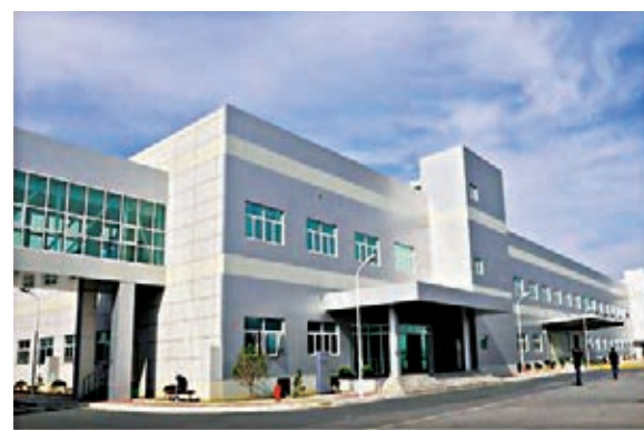
蘇州三星電子電腦有限公司製造二棟啟用