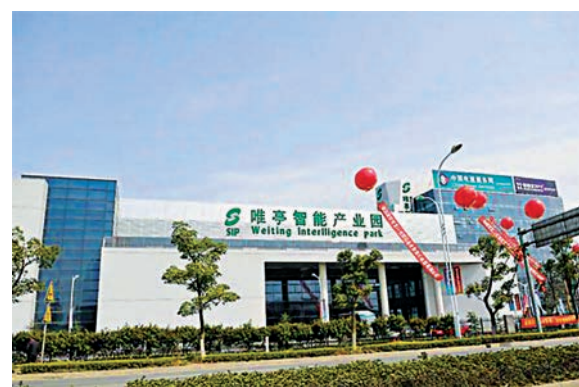
蘇州唯亭智能產業園

經過園區的引導舉措以及企業自發的行為，工業園區產業化逐步實現了優化升級，促成了園區打造現代產業集聚區的戰略目標。同時，實現產業優化升級，也是工業園區打造現在產業集聚高地的必然選擇和必由之路。（蘇州報道）