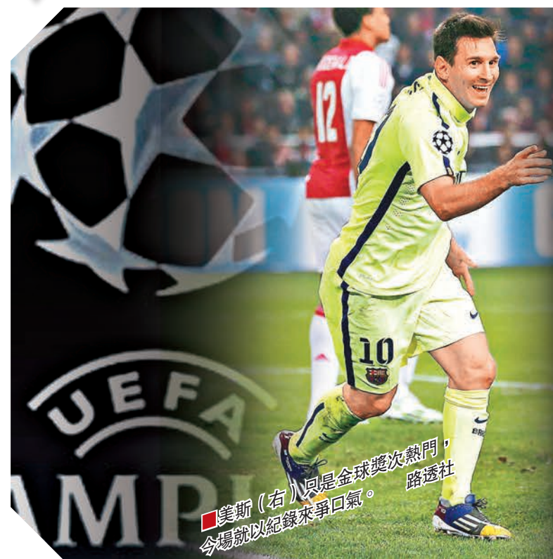
■美斯(右)只是金球獎次熱門，今場就以紀錄來爭口氣。