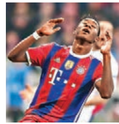
■阿拉巴是拜仁左路最可信賴的大將。