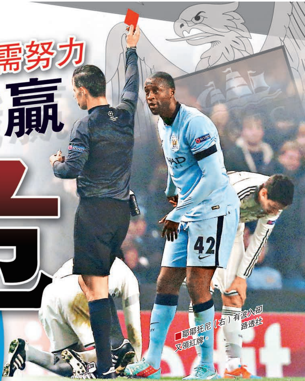
■耶耶托尼(右)有波入卻又領紅牌。

目前提前兩輪出線16強的有西甲皇家馬德里、巴塞羅那、德甲拜仁、多蒙特，法甲巴黎聖日耳門及葡超波圖，卻未見今周歐聯不勝的英超4雄蹤影。阿仙奴與車路士和波，曼城與利物浦落敗，目前在G組榜首領先第3位4分的車路士以及在D組次席領先第3名5分的阿仙奴出線形勢較好，但聯賽冠軍曼城及亞軍利物浦最後兩