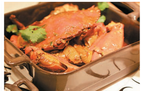
■咖啡廷的招牌菜澳門咖啡蟹

咖啡廷的招牌菜有白酒羔香炒蝦、澳門咖啡蟹、葡式焗鴨飯，其中澳門咖啡蟹，獨特的咖啡口感，其咖啡汁更是大廚師傅秘製的獨家配方。