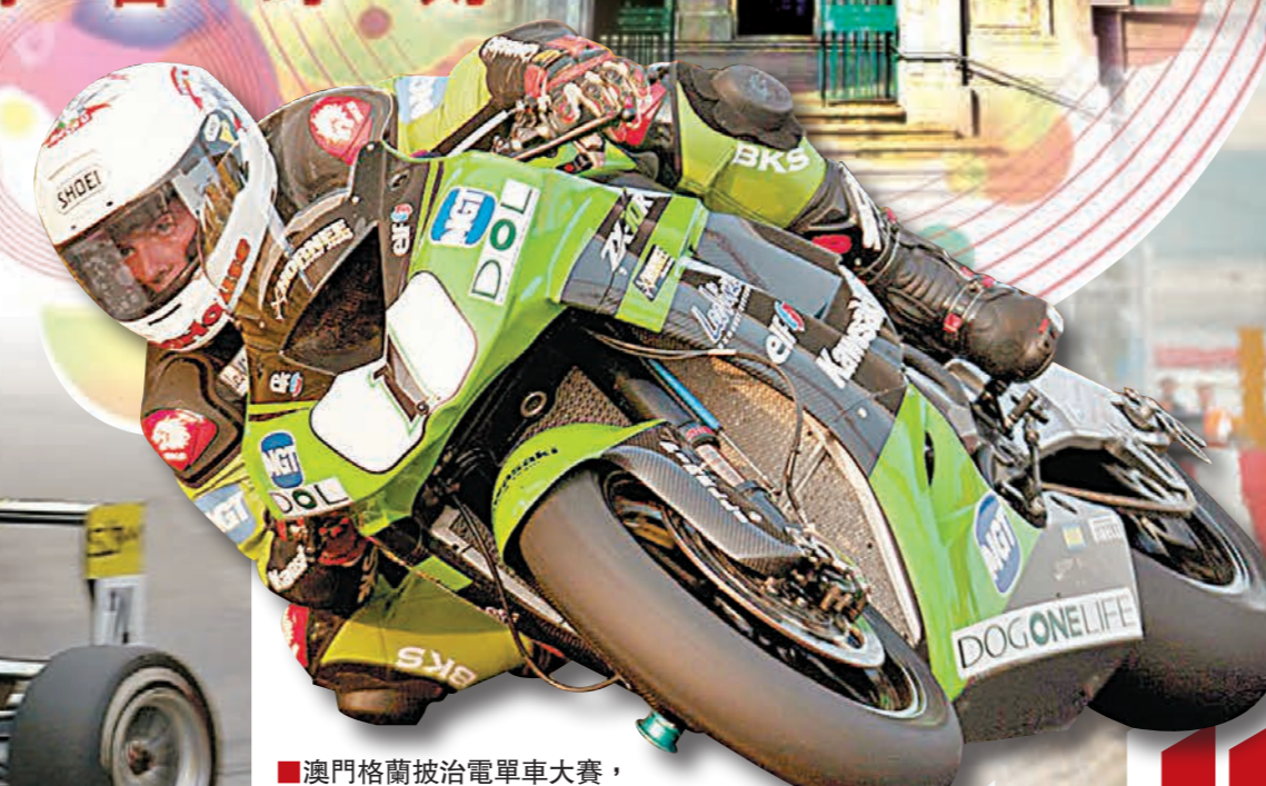
■澳門格蘭披治電單車大賽，車手在每一處彎道的表現必是最扣人心弦的一刻。