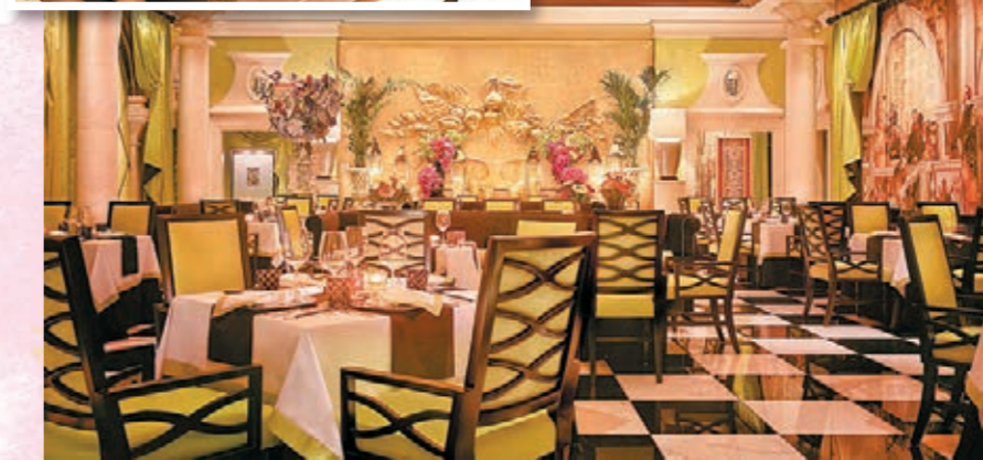
■永利咖啡廷，美食體驗之餘的視覺享受。