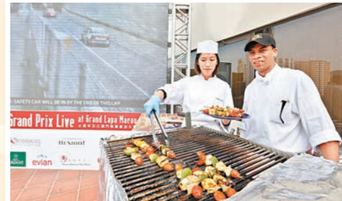
■金麗華酒店提供全日美味燒烤菜餚，不容錯過！