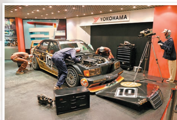
■大賽車博物館，為人們模擬再現比賽過程中遇到突發的搶修事故。