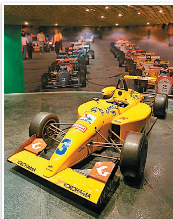
■第三十九屆澳門格蘭披治大賽車，三級方程式亞軍得主蘭尼的座駕。