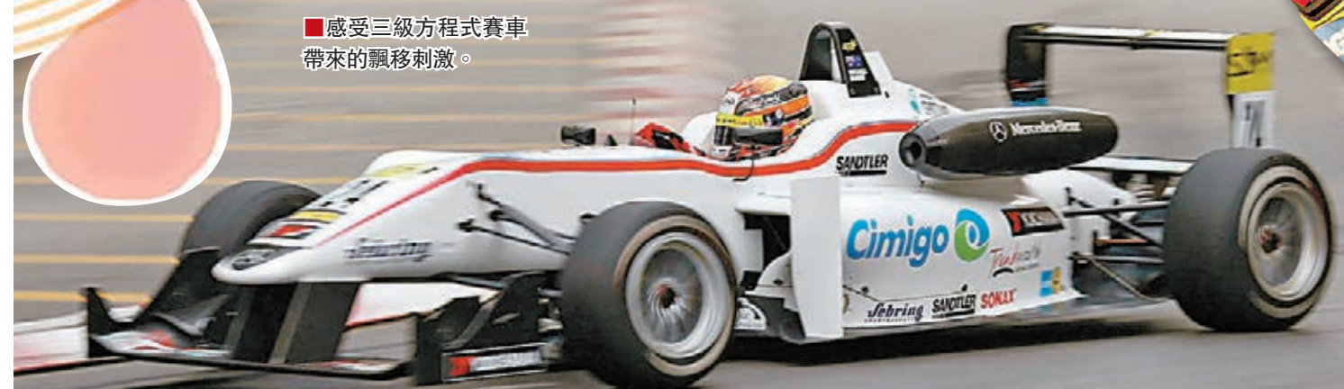
■感受三級方程式賽車帶來的飄移刺激。