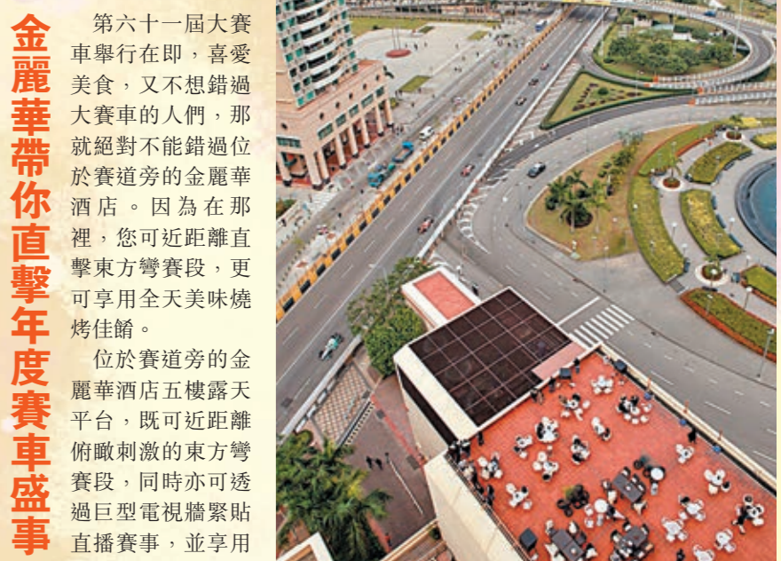
■金麗華酒店五樓露天平台，享受燒烤美食，又可近距離直擊東方賽道。