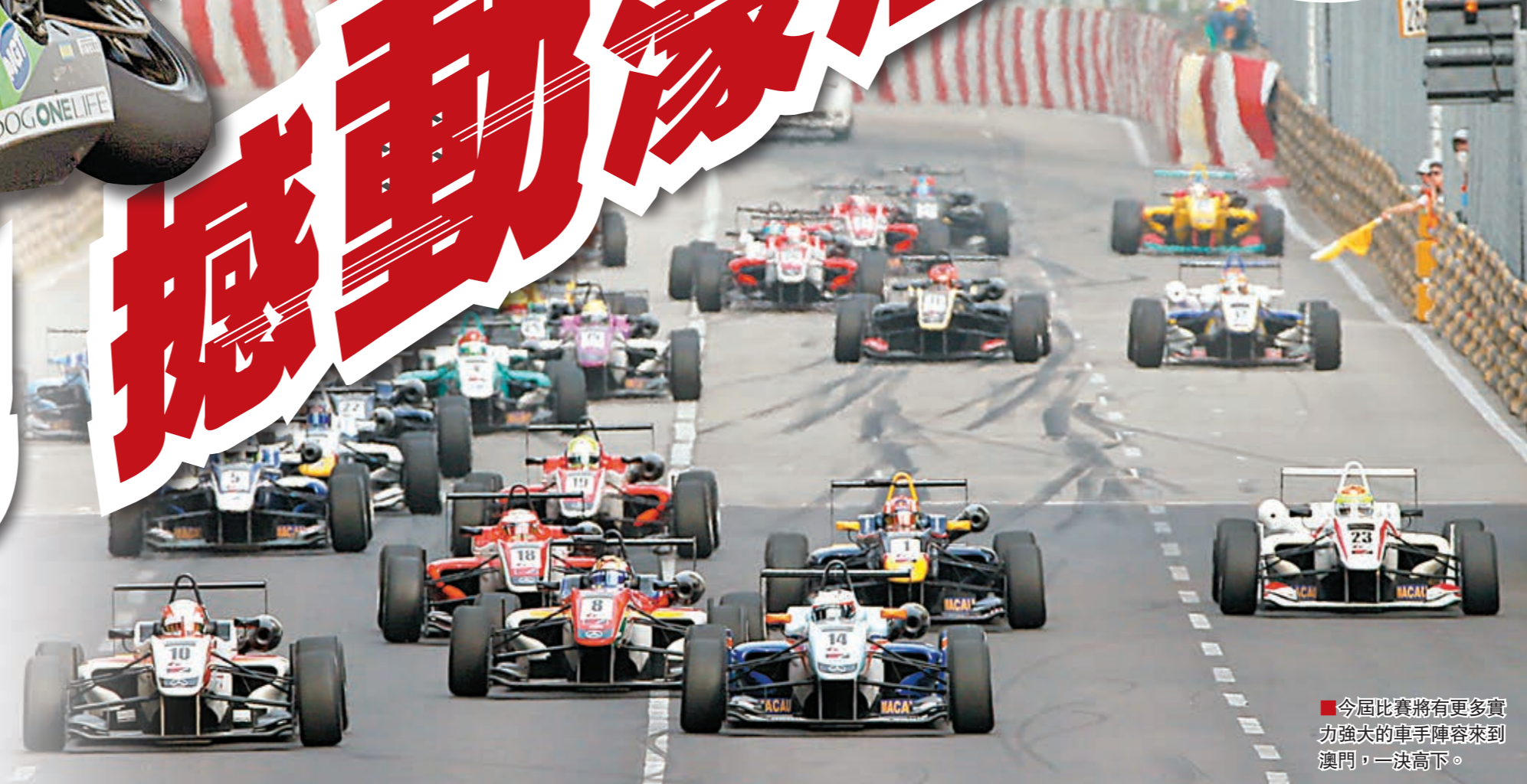
■今屆比賽將有更多實力強勁的車手陣容來到澳門，一決高下。

想感受賽車在城市街道上飛馳帶來的震撼，速度與激情原來可以如此身臨其境的體會到，那麼你就不能錯過——太陽城集團第六十一屆澳門格蘭披治大賽車。這項精彩刺激的年度國際賽事將於本月13至16日舉行，屆時將有來自36個國家及地區共211名車手來澳參加三級方程式、電單車等7項賽事，角逐多項殊榮。這場不容錯過的精彩賽事，必定震撼車迷的感覺。