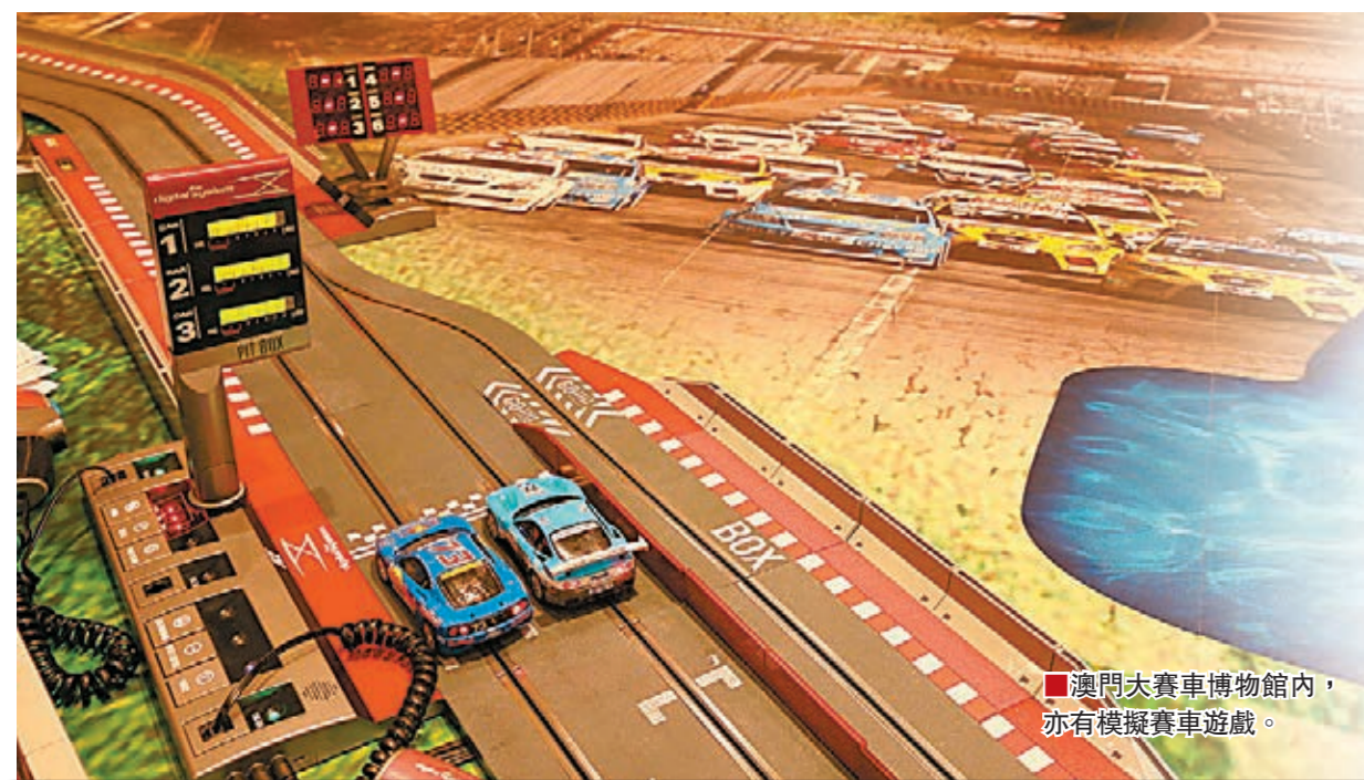
■澳門大賽車博物館內，亦有模擬賽車遊戲。