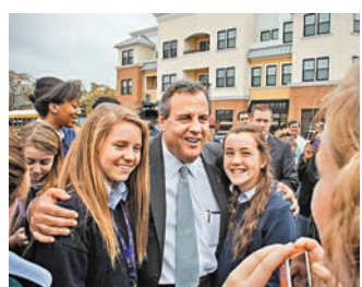
共和黨新澤西州州長 克里斯蒂

可能代表民主黨出征總統大選。分析指，相比希拉里在民主黨幾乎一枝獨秀，共和黨最少有10人有意參選，一旦內訌，希拉里很可能漁人得利。