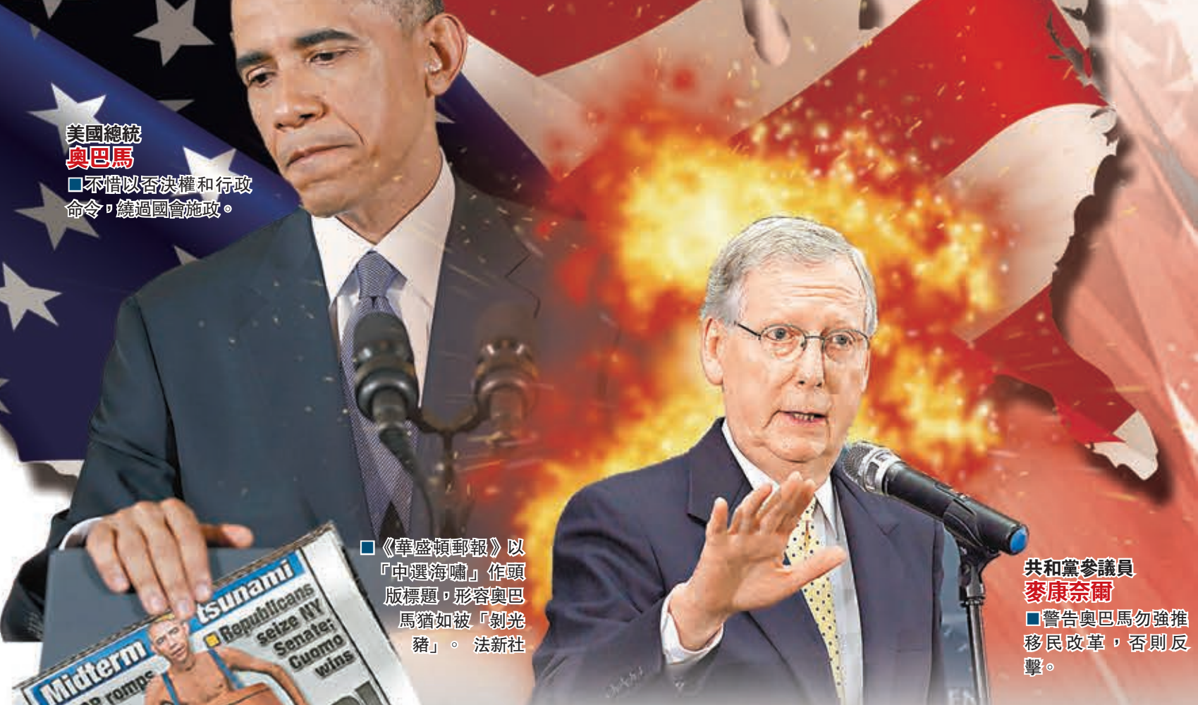
美國總統 奧巴馬 不惜以否決權和行政命令，繞過國會施政。