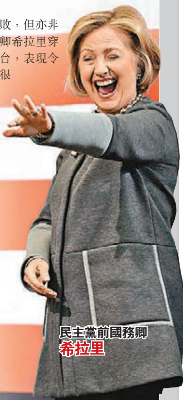
民主黨前國務卿 希拉里