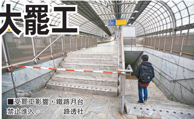
■受罷工影響，鐵路月台禁止進入。

工會要求把每周工作時由 39 小時減至 37 小時，同時加薪 5%，屬下的貨運列車司機首先罷工，其後擴至載客列車。今次將是二戰後德國為期最長的罷工，主要涉及長途列車服務，其中東部最受影響，只能維持 15% 至 30% 列車服務。