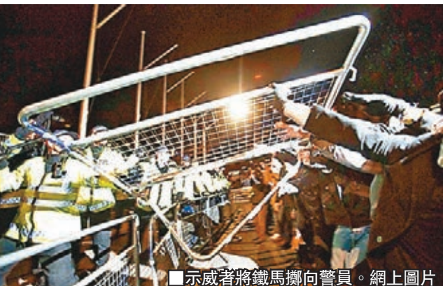
■示威者將鐵馬擲向警員。

國際黑客組織「匿名者」號召全球民眾昨晚參與「百萬面具大遊行」，逾百城市響應，其中面具主角福克斯故鄉倫敦的示威規模最大，參加者包括諾星羅素班特及設計大師「西太后」 Vivienne Westwood 等名人。示威後來演變成騷亂，當局出動警棍驅散示威者。「匿名者」號召支持者堵塞倫敦道路，防暴警察嚴陣以待。大批戴上「V」字面具的示威者昨晚在特拉法加廣場聚集，年紀最小的只有 14 歲，其後遊行至國會大樓，沿途高呼「革命是唯一辦法」等口號，反對緊縮政策及資本主義。