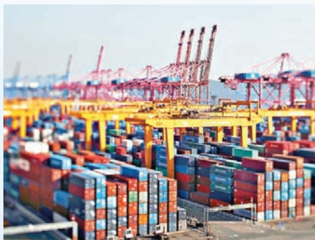
■日匯急貶導致韓國出口大受打擊。圖為釜山港口。資料圖片