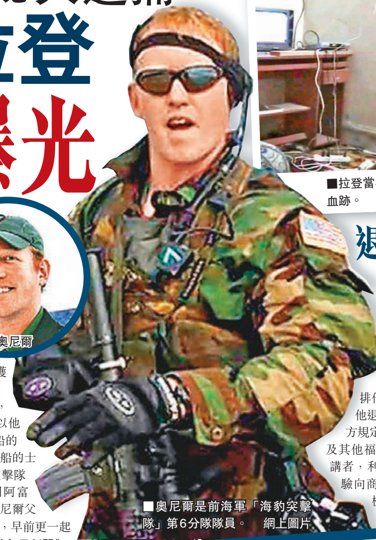
奧尼爾是前海軍「海豹突擊隊」第6分隊隊員。