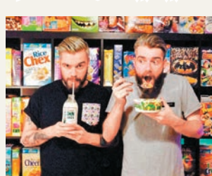
餐廳的孖生兄弟老闆有天下午想吃穀類食品卻遍尋不獲，於是決定開店。

不少人喜歡吃「脆卜卜」粟米片等穀類食品作早餐，英國倫敦即將新開一家特色餐廳，主打來自美國、法國、南非、韓國等全球各地的120種穀類食品，讓食客早、午、晚也能品嚐穀類食品。餐廳由一對來自北愛爾蘭的孖生兄弟經營，他們醉心穀類食品，有天下午想吃卻遍尋不獲，於是靈機一觸，想到自己開店，把至愛與別人分享。店內放滿來自1980和1990年代與穀類有關的收藏品，他們更找來一部懷舊電視機，播放那些年的舊卡通。13種牛奶 20種配料 穀類食品種類繁多，兩兄弟對加入一起進食的牛奶亦絕不馬虎，除了普通牛奶外，還有不含乳糖牛奶、燕麥牛奶、杏仁牛奶等13種不同奶類產品，以及20種配料。