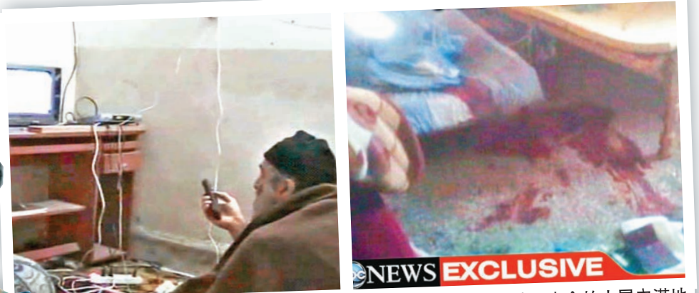
拉登當年被射殺前，觀看有關自己的報道。右圖為拉登喪命的小屋內滿地血跡。