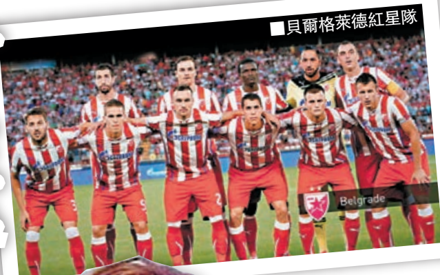
貝爾格萊德紅星隊