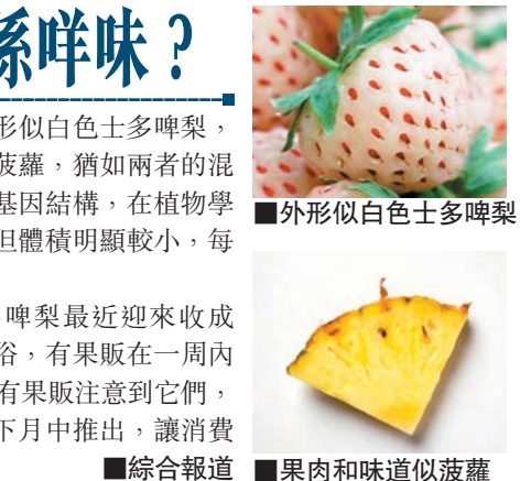
外形似白色士多啤梨

菠蘿與士多啤梨相信不少人都吃過，但兩者合而為一的「菠蘿士多啤梨」(pinberry)，你又嚐過沒有？這種水果並非惡空創造，而是源自南美洲，一度瀕臨絕種，幸好當年有荷蘭果農收集種子，帶到歐洲進行商業種植，近年開始投入市場。今年的菠蘿士多啤梨最近迎來收成期，在荷蘭銷量不俗，有果販在一周內賣了30籃。英國亦有果販注意到它們，訂購了一批，計劃下月中推出，讓消費者過白色聖誕。