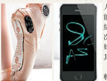
鞋底裝記錄器 程式記錄足跡 綜合報道

舞蹈是轉瞬即逝的藝術，西班牙一名藝術家為了永久留住美麗瞬間，發明了一種記錄器，利用電腦、手機等最新科技，記錄芭蕾舞舞者跳舞時畫出的軌跡。記錄器裝在芭蕾舞鞋底部，把舞鞋化身一支數碼畫筆。通過專用程式(app)，電腦會追蹤舞者跳舞時雙腳的壓力和動作，錄下的軌跡就如一幅幅獨一無二的數碼藝術品。發明記錄器的特魯巴特表示，她想錄下舞者在舞蹈中投入的感情，事後不但可以與其他舞者分享，也能讓舞者總結經驗，下次跳得更好，或者與其他舞者的「足跡」比較。