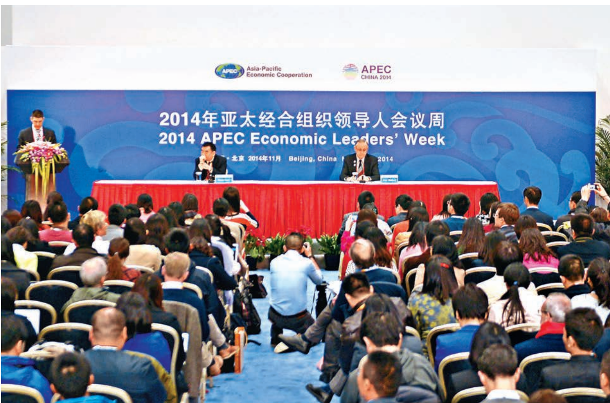
「2014中國APEC關鍵問題與倡議和APEC領導人會議周」吹風會昨日在北京國家會議中心舉行。新華社

另據美國《華爾街日報》網站引述知情人士稱, 此次會議勢必會確認一項有關腐敗案件信息共享的計劃, 這個名為反腐敗執法合作網絡(也簡稱「反腐合作網」)的機構將設在中紀委的培訓部門——中國紀檢監察學院。中央紀委副書記陳文清日前擔任該學院院長。據悉, ACT-NET由APEC各個經濟體的反腐敗和執法機構人員組成, 在APEC反腐敗工作組框架下設立, 旨在加強以追逃追贓為重點的個案合作、經驗分享和能力建設。