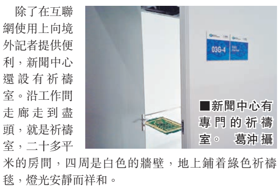
■新聞中心有專門的禱告室。

外交部發言人華春瑩前天亦在例行記者會上對此予以了反駁。她表示: 「中國互聯網是開放的, 我們將依法進行管理。如我們承諾過的, 有關部門將為峰會圓滿舉行竭盡全力。媒體中心設施齊全, 是專門為高標準提供相關服務而建造, 包括互聯網服務」。