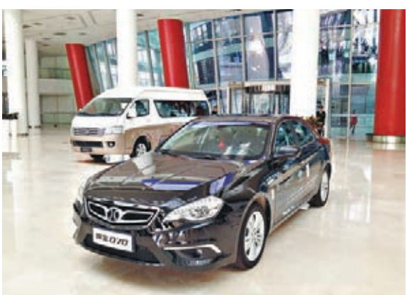
■北汽為本屆APEC提供的自主品牌轎車紳寶D70。

以北汽為代表, 本屆APEC「官方指定用車」全部為自主品牌, 而回首13年前, 中國首次舉辦APEC會議時, 在會場馳騁的都是合資品牌轎車。據了解, 中國自主品牌憑借技術創新、質量進步和日益上升的品牌影響力成功贏得APEC官方用車資格。有外媒記者評論說, 中國自主品牌汽車亮相APEC國際舞台, 彰顯出中國對自身產品的自信。