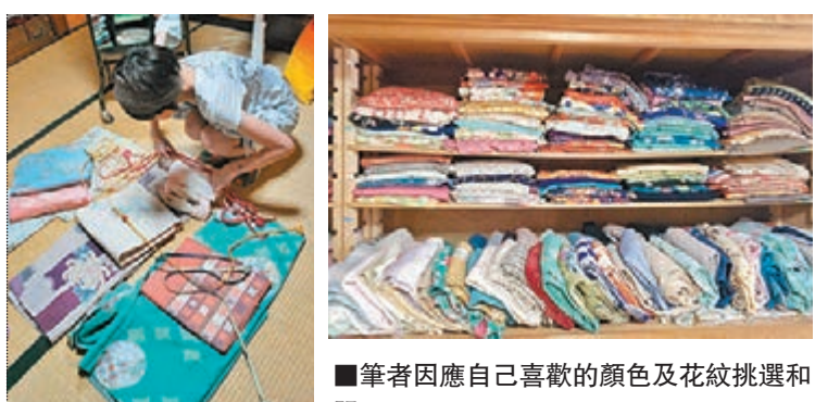
■筆者因應自己喜歡的顏色及花紋挑選和服。