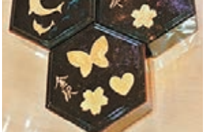
■將金箔按圖案設計貼到盒子上，輕輕按壓使之緊貼，也可以加上金粉做修飾。