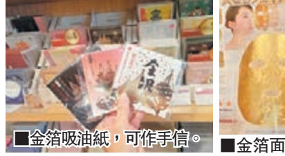
■金箔吸油紙，可作手信。 ■金箔面膜