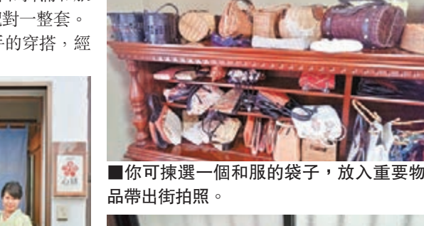
■你可揀選一個和服的袋子，放入重要物品帶出街拍照。