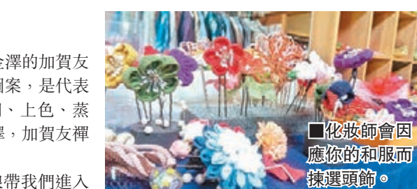
■化妝師會因應你的和服而揀選頭飾。

地址：金澤市芥子町2-5-18 收費：持有「北陸地區鐵路周遊券」，由11,840至14,800日圓（包梳理髮型） 體驗時間：10:00am至6:00pm 預約網頁： http://www.kokoyui.com