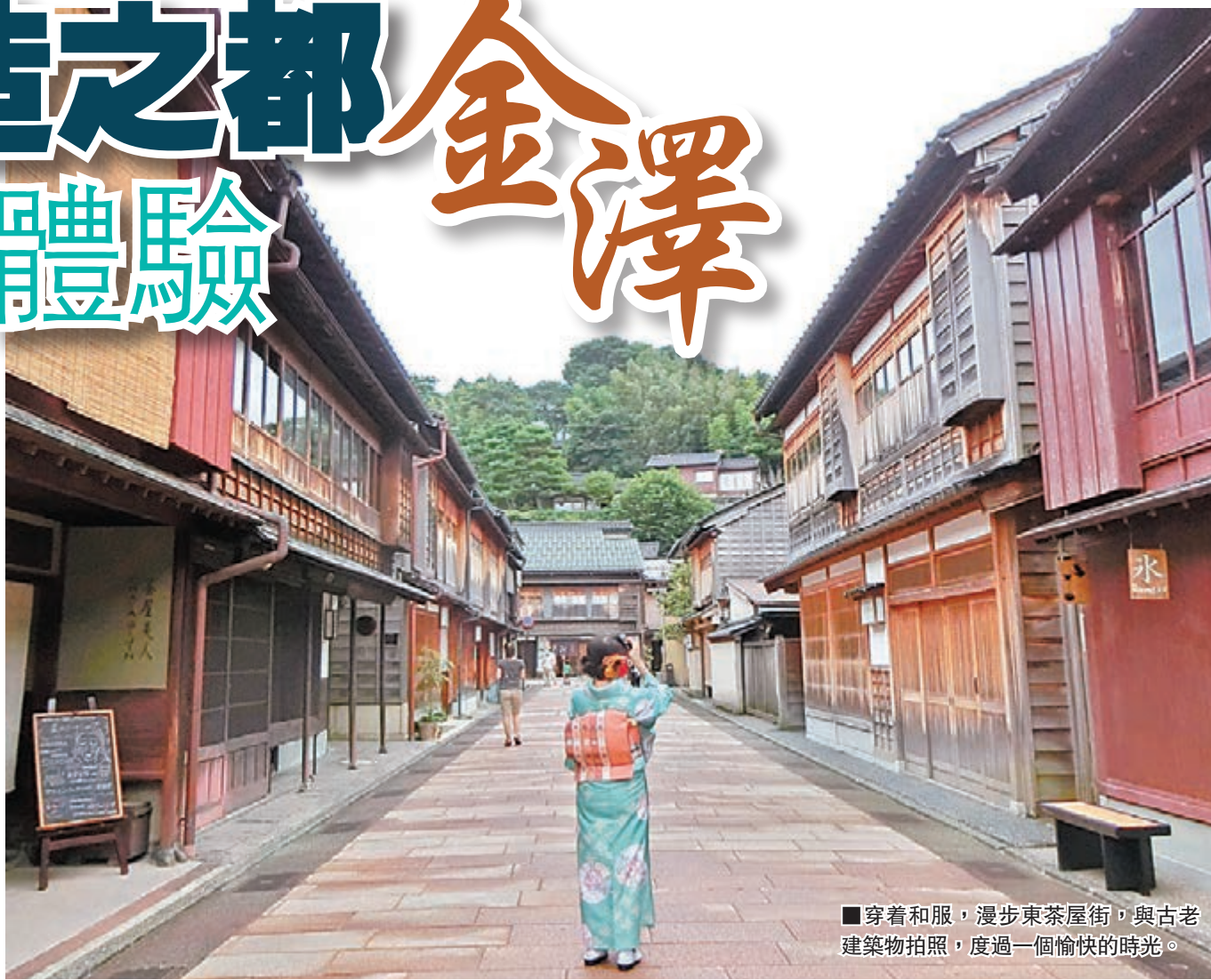
■穿着和服，漫步東茶屋街，與古老建築物拍照，度過一個愉快的時光。