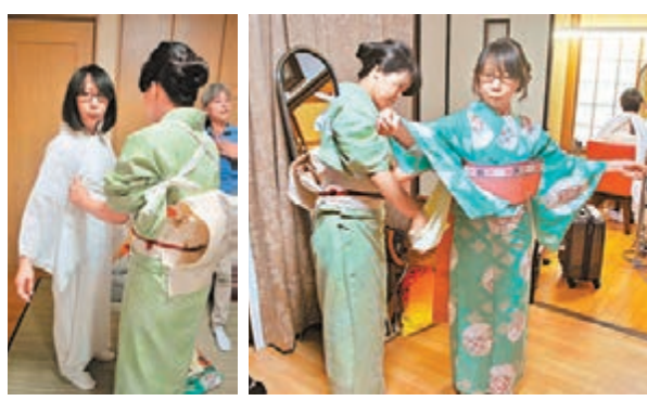
■由老闆娘親自為我們穿上和服，想不到原來是這麼厚。