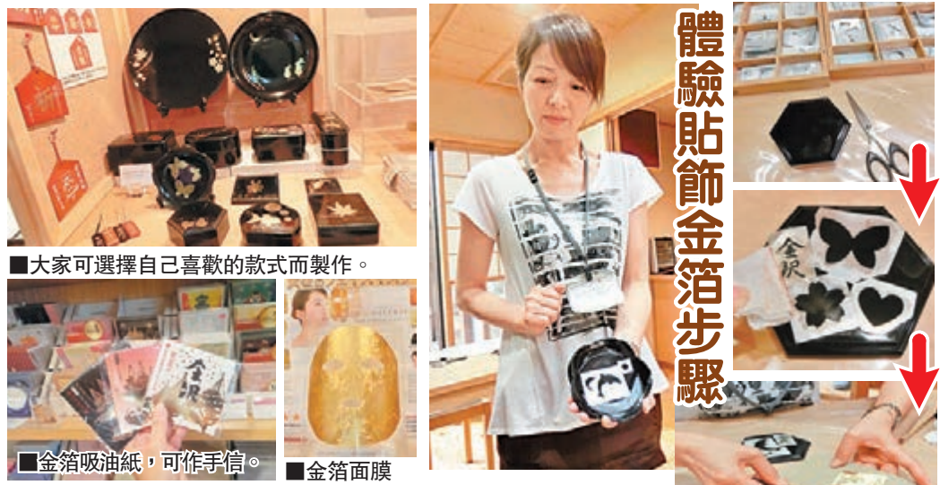
■大家可選擇自己喜歡的款式而製作。

「全球創意城市網路」的設立是為了讓孕育保有創造性及文化性產業的世界都市能相互交流而設立的，其中有分為手工業和民間藝術、設計、美食、電影、文學、音樂、媒體藝術等七個分野，金澤市被登錄在手工業和民間藝術的分野中。現在，只要你攜同「北陸地區鐵路周遊券」體驗這兒的活動，更可享折扣優惠。