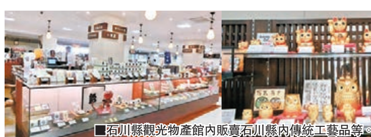
■石川縣觀光物產館內販賣石川縣內傳統工藝品等。

而金彩砂雕玻璃，在玻璃製品上用砂寫上名字，30分鐘至50分鐘體驗費1,000日圓、材料費500日圓起，10人以上的團體要預約。而筆者在這兒則體驗了加賀八幡不倒翁手繪，在可愛的鄉土人偶上畫畫，體驗費1,000日圓（不需預約）。