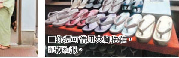
■你還可借用夾腳拖鞋，配襯和服。