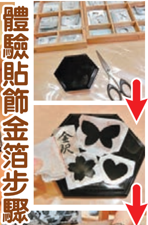
體驗貼飾金箔步驟

設有澳門威尼斯人、澳門金沙城中心康萊德酒店、澳門喜來登金沙城中心酒店及澳門金沙城中心假日酒店的澳門金沙度假區，由11月5日至11月11日晚上8時（澳門時間）推出限時「澳門熱賣」酒店住宿優惠，入住日期為今年11月5日至明年（2015年）3月31日，價格由港幣908元起，低至六五折。有關優惠活動的詳細內容，可瀏覽 cotaistrip.com/macao-getaway 。