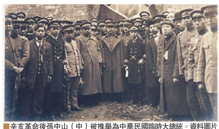
辛亥革命後孫中山（中）被推舉為中華民國臨時大總統。