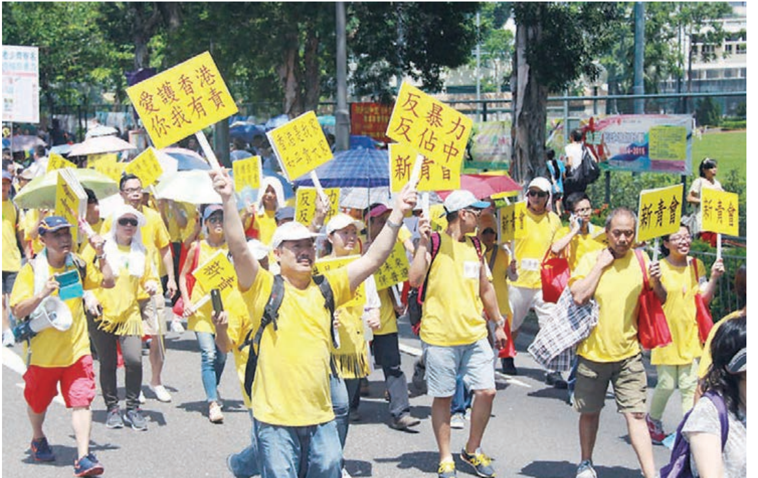
不少民眾舉起「反佔中，保普選」等示威標語遊行。