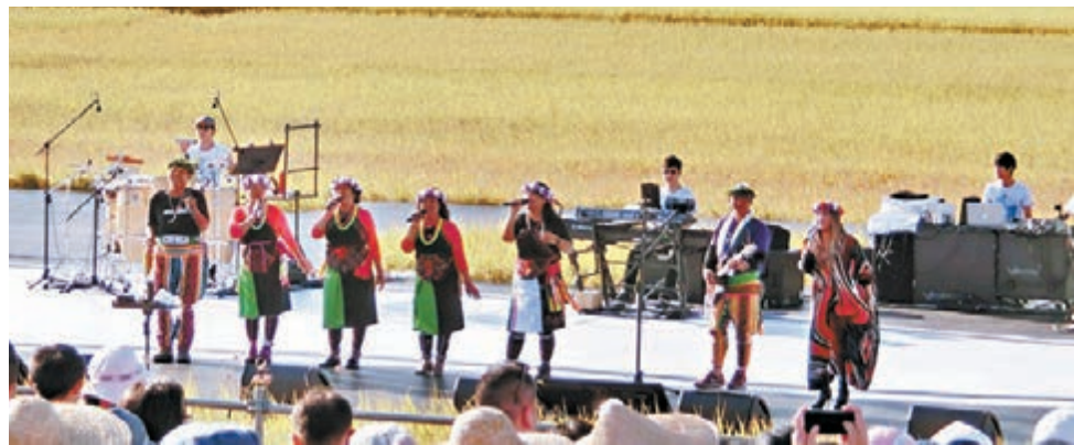
張惠妹請一眾親友上台表演。