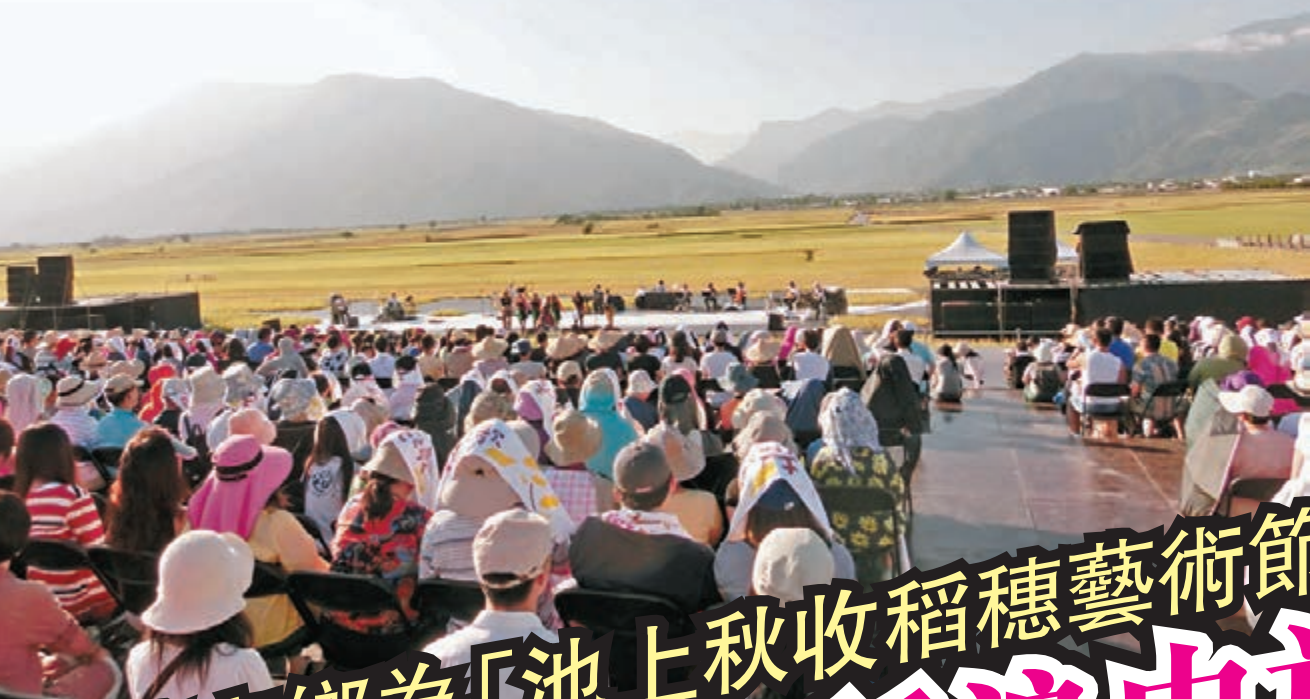
張惠妹在稻田上唱歌分文不收。