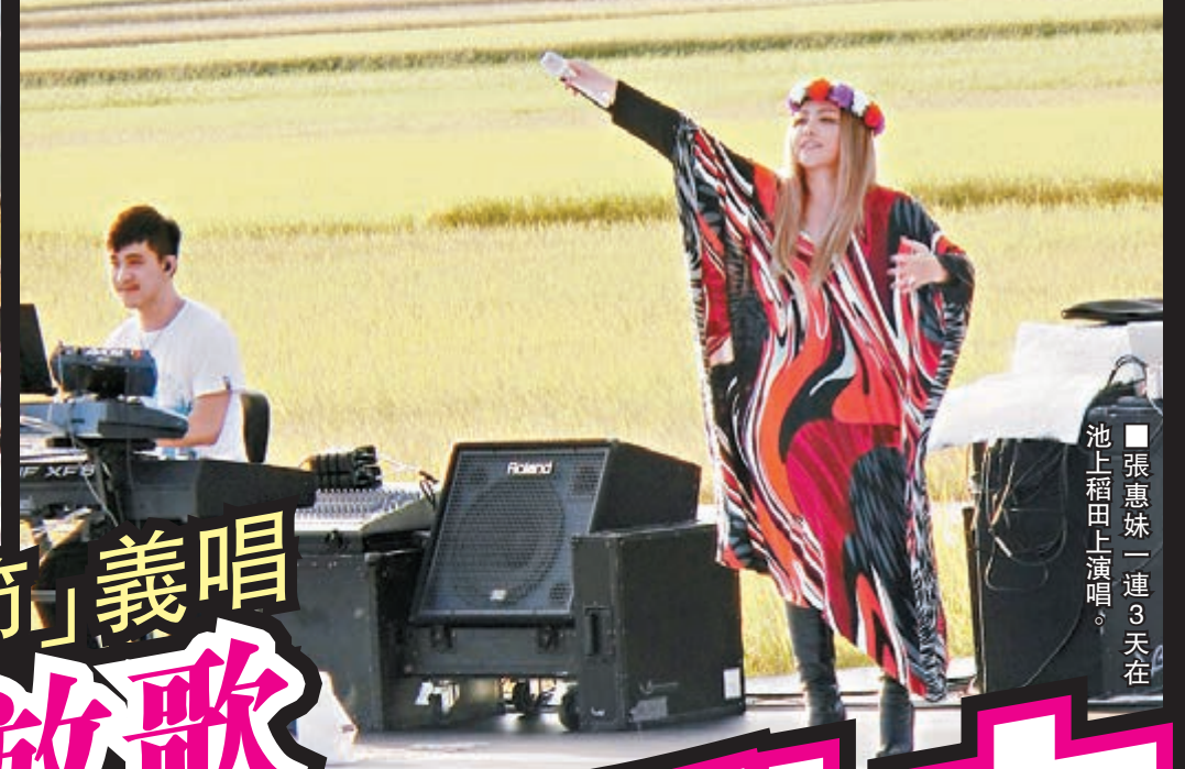
張惠妹一連3天在池上稻田上演唱。