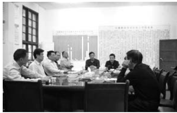
■ 長沙市棚改計劃有序穩步推進。

該電子審批系統更是領先全國，直接對接長房集團、市房屋產權監理處、市住建、民政等8個部門，可實行網上一站