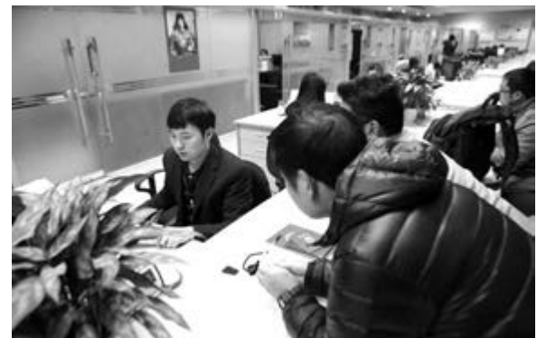
■ 長沙市住房保障局登記審批開通綠色通道。

分年推進，預計總投資520.38億元。並在長沙市十四屆人大常委會第十三次會議第二次全體會議上，表決通過，將其納入2014年國民經濟和社會發展計劃。