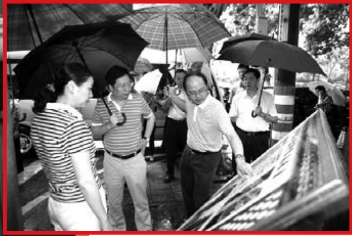
■ 胡衡華市長調研棚改項目。