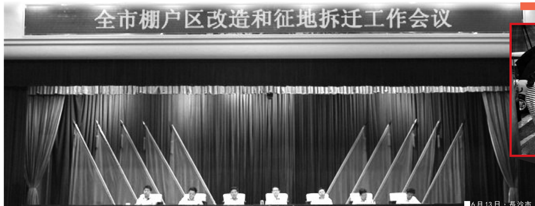
■ 6月13日，長沙市棚改專題會議召開，部署棚改工作。