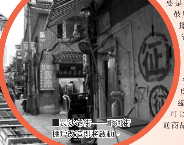
■ 長沙老街——下河街棚戶改造即將啟動。