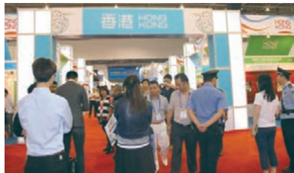
香港展館80多家企業180多個展位，參展企業希望借助海博會尋求更多合作商機。

此次海博會，旅遊合作也成為其中一大亮點。會上舉行了廣東21世紀海上絲綢之路旅遊國際合作簽約儀式，來自海上絲綢之路沿線18個國家和地區的有關旅遊部門、旅遊協會、旅遊企業以及遊輪公司、航空公司等相關企業代表簽訂了旅遊管理協作、旅遊業務合作、旅遊包機航線、旅遊投資貿易、旅遊服務採購等五類協議共59項，協議金額137.74億元。根據協議，廣東旅遊業界將在海上絲綢之路旅遊資源開發、項目建設、線路打造、宣傳促銷、客源輸送、地接服務等方面進一步加強與相關國家和地區的互利合作。