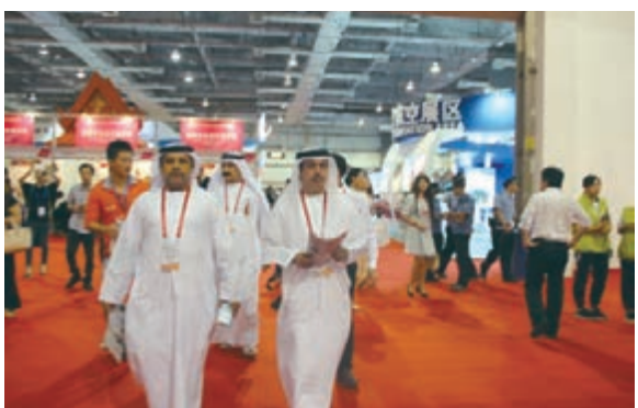
海博會贏得了海內外客商的高度認可和讚揚。

對旅遊業的需求也越來越高，而中國和東盟國家都有着眾多人口，這一切都是發展旅遊業的很好資源。借由海博會的平台，中國應該跟東盟各國商討連接相互之間的港口、機場，拓寬旅遊合作渠道。