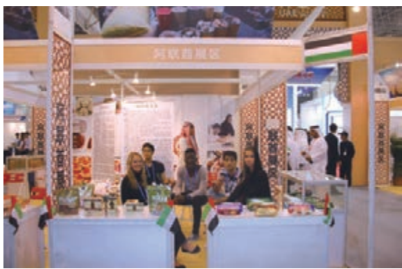
此次海博會吸引了泰國、印度、阿聯酋、波蘭等42個國家和地區參展，圖為阿聯酋展區。