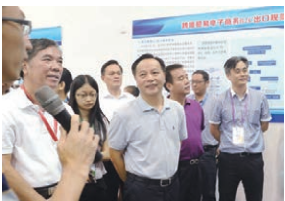
東莞市委書記徐建華視察東莞跨境電子商務O2O外貿交易會。

紹，因跨境電商避免了海外進口商、批發商和經銷商等，從而可令成本降低三至五成，間接便大幅提高了中國出口產品的競爭力，受到海外許多消費者的歡迎。據了解，網貿會由市跨境辦、市商務局、市跨境電子商務協會舉辦，旨在推動東莞產品加快進入跨境電商的交易體系。據統計，本屆網貿會期間，達成近300項意向採購協議，近5000名國際買手入場採購，項目投資金額達1.5億元。