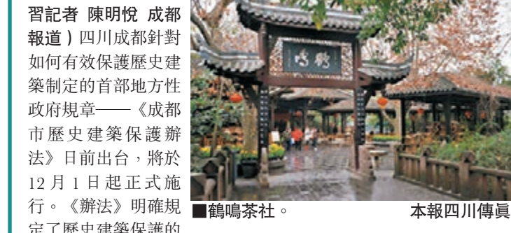
■鶴鳴茶社。本報四川傳真

香港文匯報訊(實習記者 陳明悅 成都報導)四川成都針對如何有效保護歷史建築制定的首部地方性政府規章——《成都市歷史建築保護辦法》日前出台,將於12月1日起正式施行。《辦法》明確規定了歷史建築保護的管理體制機制、職責分工、資金來源、認定標準和程序、維護修繕、安全監管、合理利用、處罰措施等,加強對承載着城市的歷史記憶和文化元素的老建築實施搶救性保護。據悉,成都市歷史建築保護辦公室歷時兩年對「全域成都」範圍內的老建築進行了普查調研,初步梳理出具有保護價值的老建築973處,目前正按照「先易後難」的原則分期分批實施保護。現已有華西協合大學中國文化研究所舊址、鶴鳴茶社、邱家祠堂等15處歷史建築保護名錄獲成都市人民政府批准公佈。