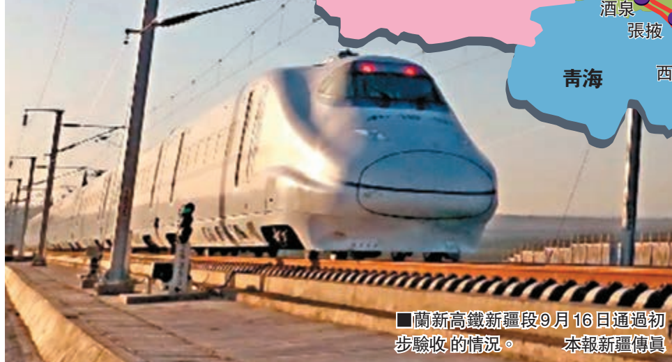
■蘭新高鐵新疆段9月16日通過初步驗收的情況。本報新疆傳真

香港文匯報訊(記者 馬晶晶 烏魯木齊報導)新疆首條高鐵——蘭新高鐵將於本月16日開通。蘭新高鐵先期開通新疆段(烏魯木齊南至哈密段)運營,全長530公里,設烏魯木齊南、吐魯番北、鄯善北、吐哈、哈密5個運營站;屆時烏魯木齊南至哈密的運行時間由5小時縮短至3小時左右。首日開行的動車車票由今日11時開始發售。