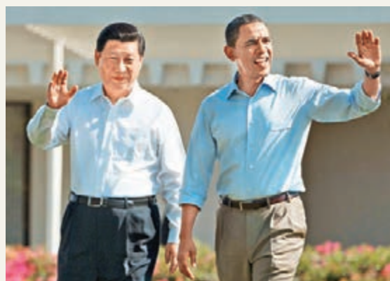
■2013年6月，習近平與奧巴馬在加州陽光莊園散步。

此外，菲律賓、越南近年亦不斷在南海挑起事端，美國雖然表面上一直表示不持立場，但事實上又不斷插手。對此，郭憲綱建議，中國從外交上要堅持地區內國家通過雙邊談判尋求解決辦法，同時，需採取扎實的步驟，增強在南海的力量。