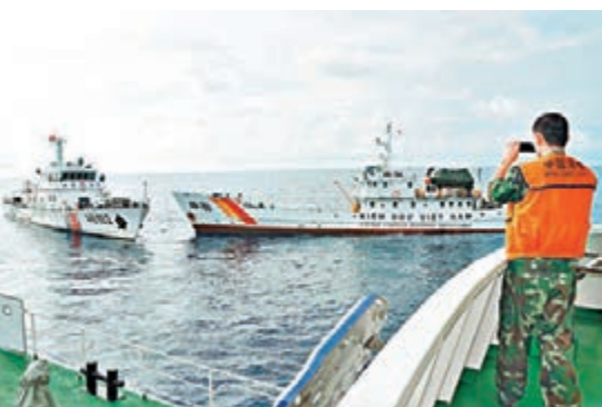
■今年5月16日，越南海監船企圖衝撞中國海警船。