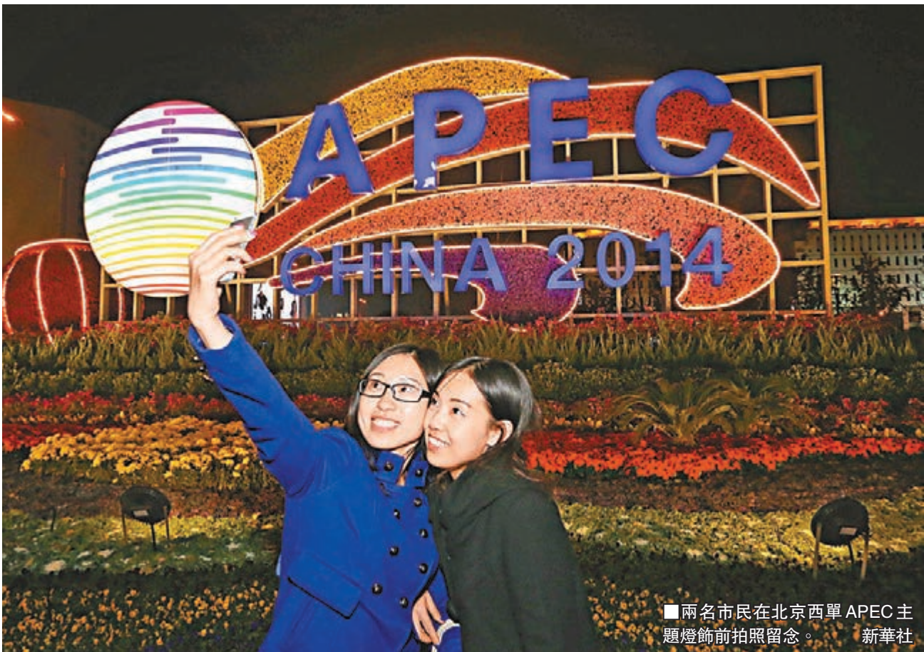
兩名市民在北京西單APEC主題燈飾前拍照留念。

APEC領導人會議周期間，還將於9日至10日舉行APEC工商領導人峰會和APEC領導人與工商諮詢理事會代表對話會，習近平也將出席並發表重要講話。