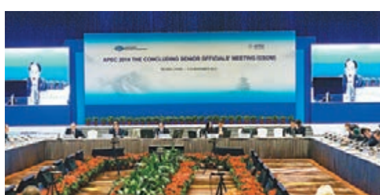
2014年亞太經合組織（APEC）最後一次高官會在北京國家會議中心開始舉行。

香港文匯報訊 2014年亞太經合組織（簡稱APEC）最後一次高官會昨日在北京舉行，反腐敗執法合作成為APEC成員高官和各國媒體關注的議題。中國、俄羅斯和美國的代表均表示期待各APEC成員