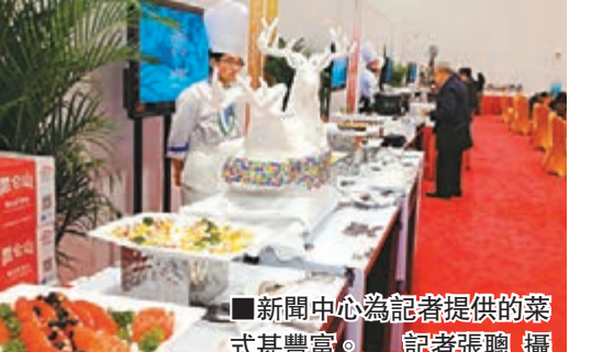
新聞中心為記者提供的菜式豐富。