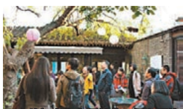
中外記者在南鑼鼓巷。

老屋、老樹、老字號林立的巷子中，融合東西方的原創文化自然融入其中，南鑼鼓巷的中西合璧給記者們留下了深刻的印象。「出其布意」、「找茶」、「這兒沒玉米汁兒」，從這些店舖的名稱中，可以看出獨具匠心的創造力。自南鑼鼓巷南口一路向北一百米處，一家名為「啞提」的飯店，東西文化交融可窺一斑。魚香肉絲比薩、回鍋肉比薩、宮爆雞丁比