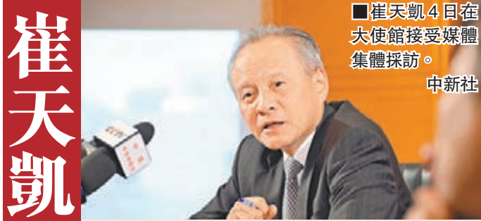
崔天凱4日在大使館接受媒體集體採訪。