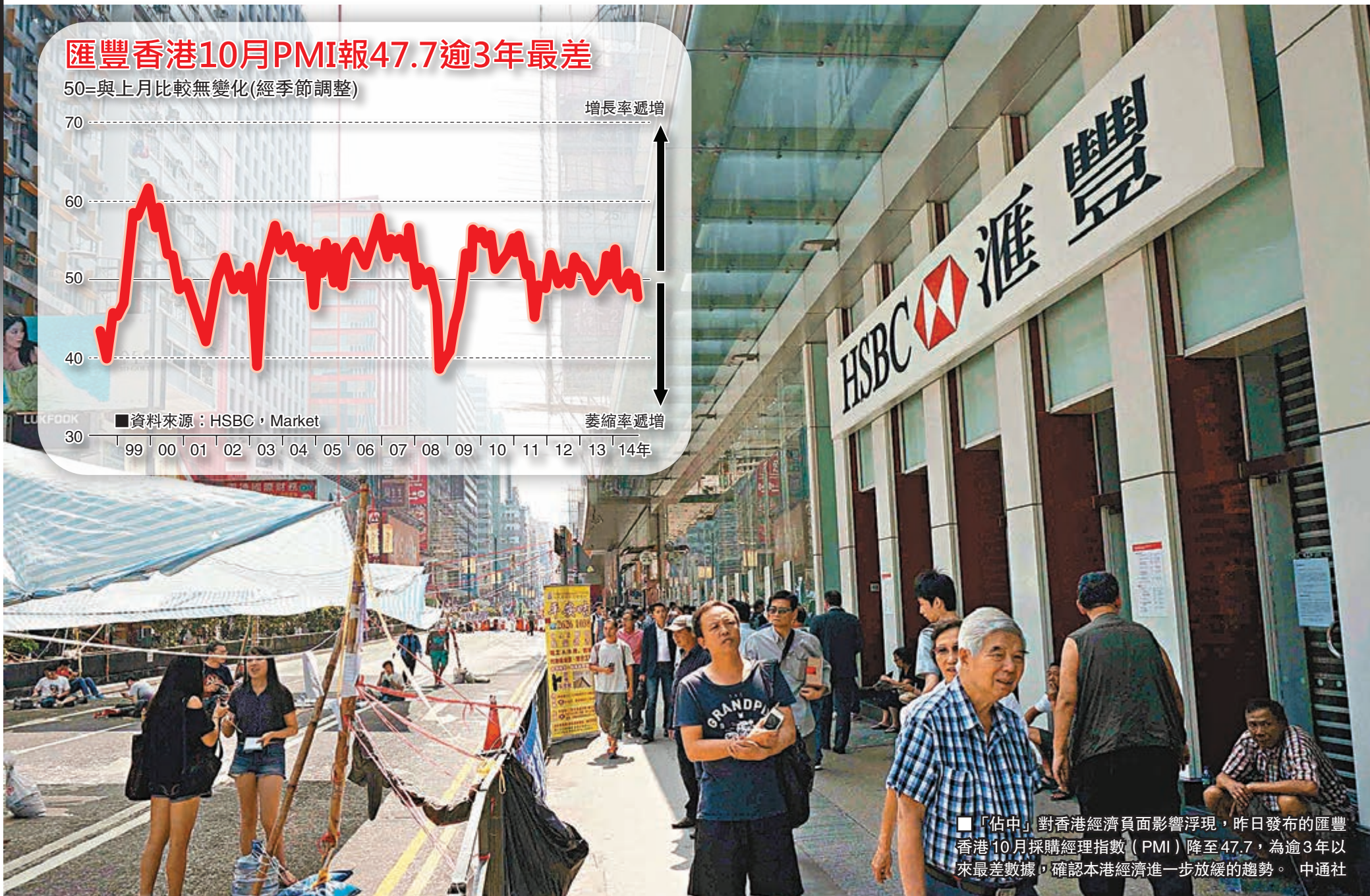
匯豐香港10月PMI報47.7逾3年最差