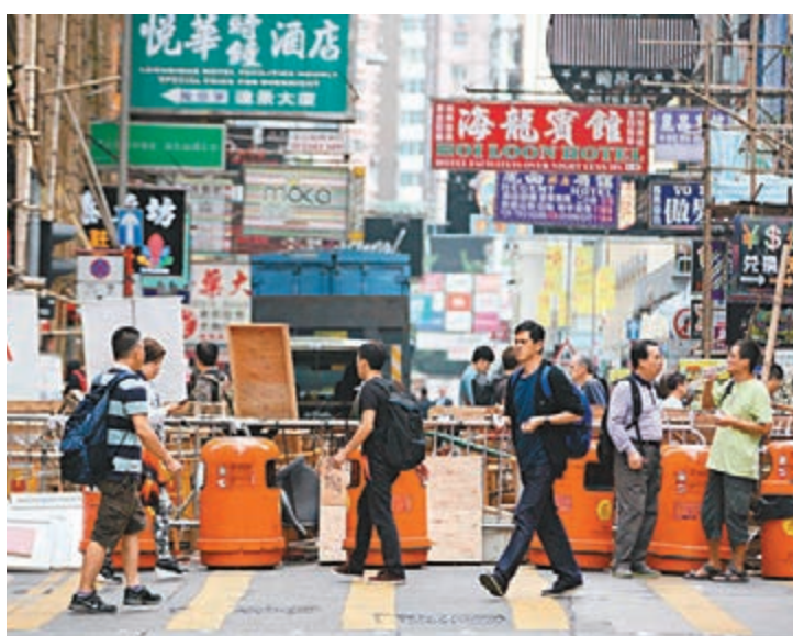
非法「佔中」已長達40天,旺角阻街路障對經濟民生的損害日益凸顯。

另外,匯豐昨還公布內地服務業採購經理指數,10月份回落至52.9,為3個月最低,反映內地服務業發展增進放緩。期內,服務業就業指數升至7個月高位,至51.7;新業務指數則變動不大。