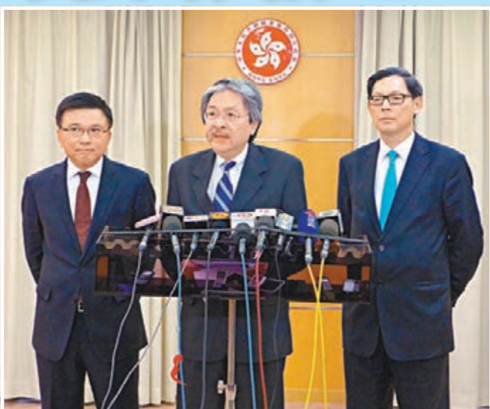
曾俊華(中)、陳家強(左)和陳德霖昨日結束訪京前在香港駐京辦會見傳媒。

被問及進一步推動香港離岸人民幣市場發展方面,曾俊華表示,已向相關部委反映香港希望爭取增加RQFII投資額度,以滿足港市場的實際需要,同時亦與有關方面商討取消港人每人每日兌換兩萬元人民幣的舉措,希望可以盡早落實。在保險業務方面,他就加強兩地雙向跨境人民幣再保險的合作,促進人民幣國際化進程向相關部委爭取支持。