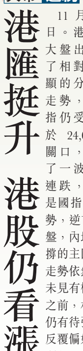
葉尚志 第一上海 首席策略師