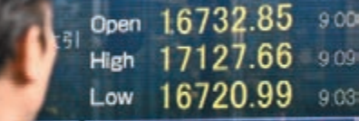
日經指數最高曾見17,127點。

日本央行上周在毫無先兆下擴大量化寬鬆(QE)規模，推低日圓匯率，日經平均指數昨日上午一度升穿萬七點大關，最高見17,127點，收市仍站穩16,862點，升448點，相隔7年終收復16,800點關口。日圓匯率在紐約匯市插水式下跌後，在低位有支持，昨日在亞洲匯市稍為回升至每美元兌113.33日圓水平。首相安倍晉三表示，將推出日圓貶值的對應策略。副首相兼財相麻生太郎亦表示擴大QE目的是擺脫通縮，並不是貨幣貶值，暗示會為受日圓貶值影響的進出口中小企提供支援。