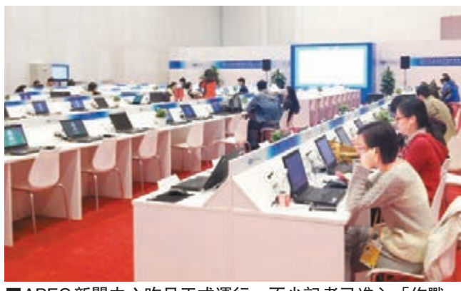
APEC新聞中心昨日正式運行，不少記者已進入「作戰」狀態。