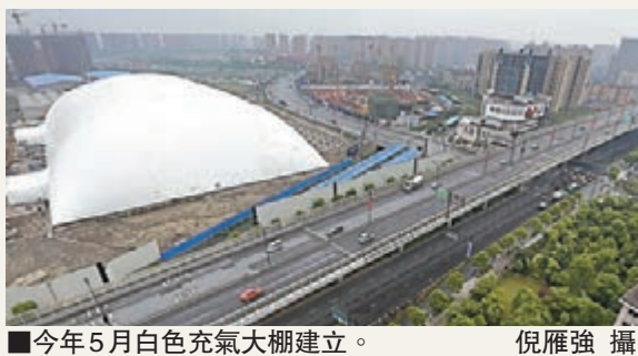
今年5月白色充氣大棚建立。

有限公司的工作人員表示，目前，重度污染部分土壤已經挖掘完畢，所以沒有必要再蓋着「毒氣帳篷」。但大棚覆蓋區域外的區塊也有輕度污染的土壤，所以仍有特殊的氣味。