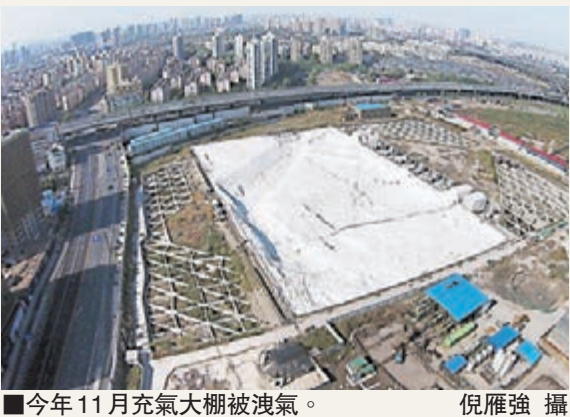
今年11月充氣大棚被洩氣。

有限公司的工作人員表示，目前，重度污染部分土壤已經挖掘完畢，所以沒有必要再蓋着「毒氣帳篷」。但大棚覆蓋區域外的區塊也有輕度污染的土壤，所以仍有特殊的氣味。