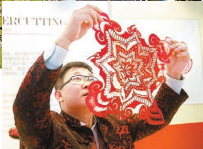
國際會議中心內的「京味兒」。新華社