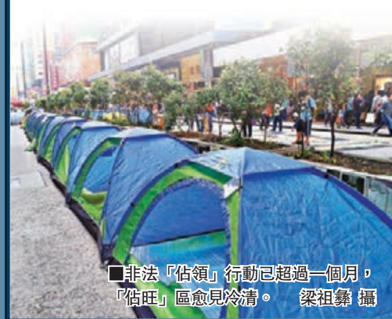
非法「佔領」行動已超過一個月，「佔領」區愈見冷清。