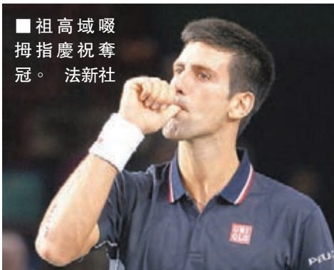
祖高域慶祝奪冠。

目前祖高域在世界排名榜以1310分領先費達拿，後者若成為「年終一哥」，必須贏得稍後的年終賽冠軍，收穫1500分，以及可