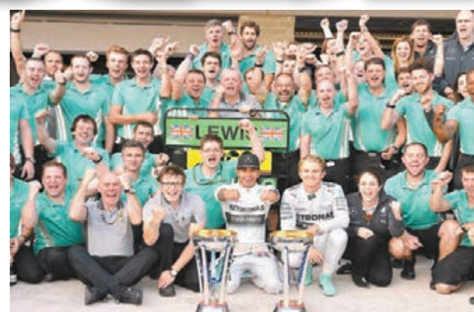
平治車隊今季第10次包攬分冠亞軍，認真威水。