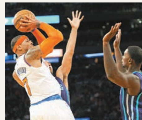
安東尼(左)跳投。

紐約人前鋒安東尼周日在主场攻入28分，帶領球隊以96:93捕捉黃蜂，取得2連勝，個人職業生涯總得分還突破2萬分，成為史上最年輕達到這個里程碑的第6人。