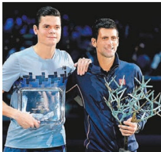
祖高域(右)擊敗拉奧歷，贏得第20個大師賽「1000級別」冠軍。

榮升「祖爸爸」的男網「世界第一哥」祖高域，周日在巴黎大師賽決賽以6:2和6:3的盤數，輕取加拿大「發球機器」拉奧歷，錄得個人職業生涯第600場勝仗，贏得第20個大師賽「1000級別」冠軍，並成為首名能夠在這項賽事衛冕的男單球手，風頭一時無兩，賽後祖高域將勝利獻給極好腳頭的兒子。