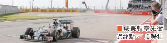
威美頓率先衝過終點。

威美頓今仗排在羅斯保之後，以第2位起步，但戰至第24圈，成功超越對方，最終以4.314秒的領先優勢壓倒羅斯保，率先衝過終點，贏得個人今季第10個分站冠軍，亦是個人職業生涯第32個分站冠軍，超越名宿文素，成為獲得最多分站冠軍的英國F1車手，而連續5站掄元，追平了文素在1992年創下的英國車手紀錄。