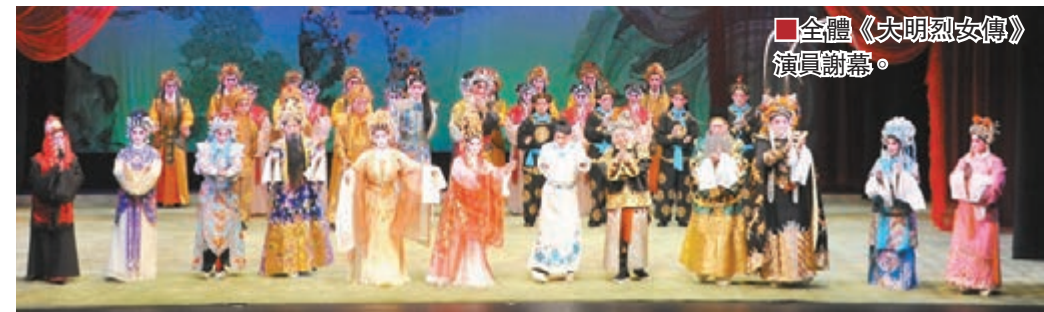
全體《大明烈女傳》演員謝幕。