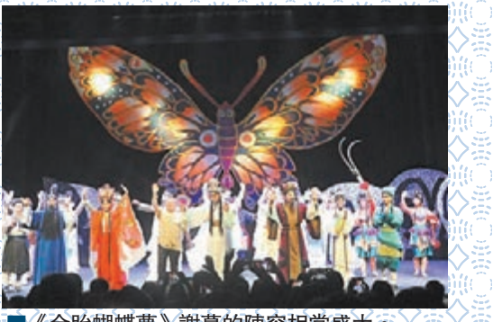
《金胎蝴蝶夢》謝幕的陣容相當盛大。