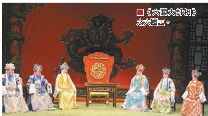
《六國大封相》之六國國王。