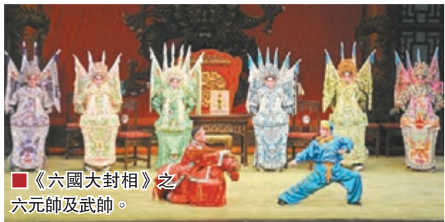
《六國大封相》之六元帥及武師。