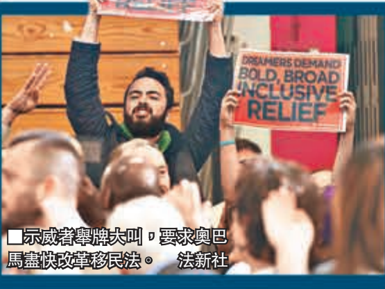
■示威者舉牌大叫，要求奧巴馬盡快改革移民法。