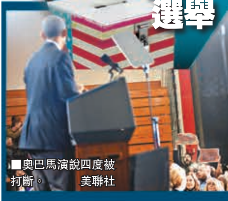
■奧巴馬演說四度被打斷。