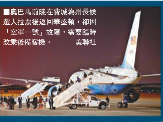
■奧巴馬前晚在費城為州長候選人拉票後返回華盛頓，卻因「空軍一號」故障，需要臨時改乘後備客機。

美國中期選舉今日舉行，候選人趁最後時刻積極拉票之際，民望低迷的總統奧巴馬淪為「票房毒藥」，只有少數民主黨候選人願意邀他站台。奧巴馬前日到民主黨票倉之一的康涅狄格州，為州長候選人馬洛伊拉票，但因台下觀眾叫囂而四度中斷演說。奧巴馬曾形容今次中選可能是他任內最後一次助選活動，「迎接」他的卻是噓聲而非掌聲，實在情何以堪。