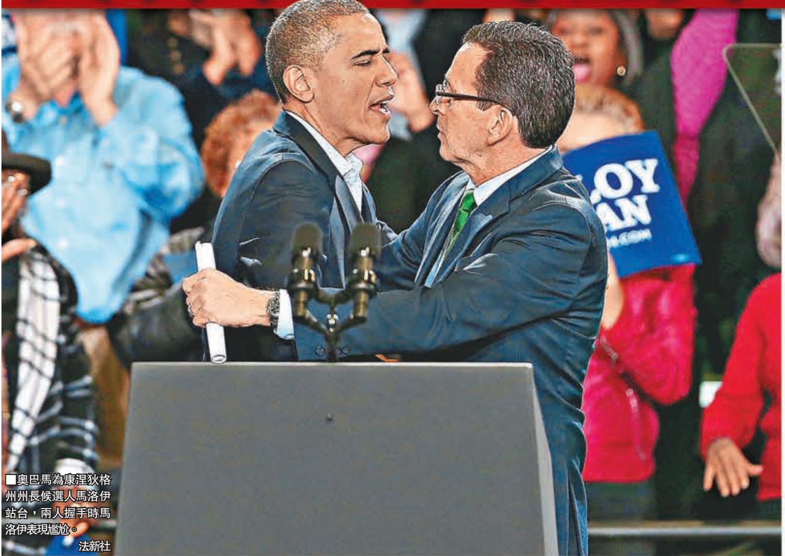
■奧巴馬為康涅狄格州州長候選人馬洛伊站台，兩人握手時馬洛伊表現尷尬。