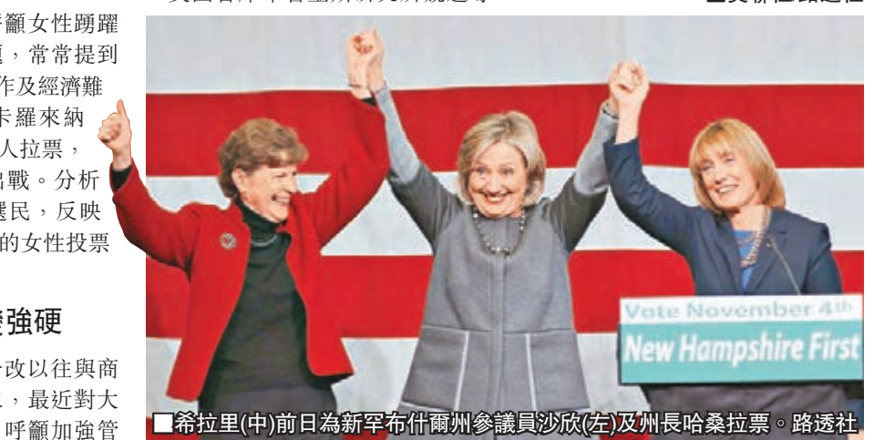
■希拉里(中)前日為新罕布爾州參議員沙欣(左)及州長哈桑拉票。

制高風險金融活動，防止危機重臨再次要納稅人埋單。分析認為，希拉里是希望爭取自由派選票，盡量擴闊支持者階層。美國智庫布魯金斯研究所競選專家赫達克認為，希拉里正嘗試確立自己給選民的訊息，因為這是在2008年(初選敗給奧巴馬時)未能做到的。