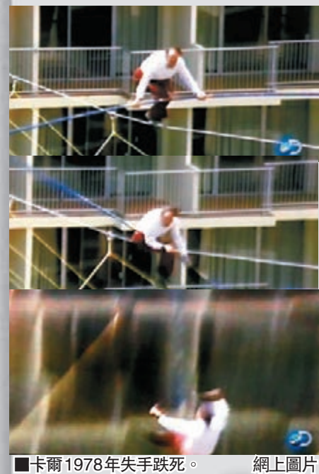
■卡爾1978年失手跌死。

瓦倫達出身於美國知名特技表演世家「飛天瓦倫達」，其家族七代均從事走鋼線表演工作，母親及姊姊都是箇中高手。當年「飛天瓦倫達」以7人疊羅漢走鋼線聞名歐美，但走鋼線畢竟是高危動作，家族內至今最少5人因此死於非命，包括瓦倫達的曾祖父卡爾，於1978年在波多黎各各電視直播表演期間，失手從121呎高空跌死。