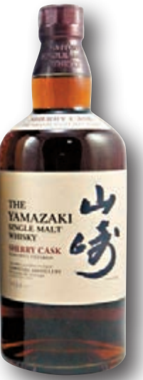
■山崎Sherry Cask單一麥芽威士忌