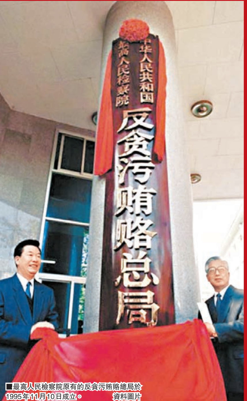
■最高人民檢察院原有的反貪污賄賂總局於1995年11月10日成立。