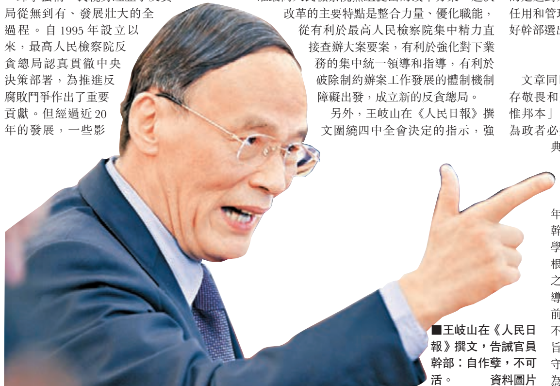
■王岐山在《人民日報》撰文，告誡官員幹部：自作孽，不可活。

文章同時指出，領導幹部要知古鑒今、心存敬畏和戒懼。中國古代政治思想強調「民惟邦本」、「水則載舟、水則覆舟」，告誡為政者必須體察民情、關注民生。中國傳統典籍還有許多官德官箴，告誡為官者，官職越高、權力越大，越應戰戰兢兢、如履薄冰。《論語》中說：君子三年不為禮，禮必壞；三年不為樂，樂必崩。現在，有的領導幹部忘記了自己是黨的幹部，不知不學黨規黨紀，無視規矩、不講廉恥，根本不把國法黨規當回事，沒有戒懼之心。黨的十八大以來查處的黨員領導幹部案，沒有一個不是在違法之前首先違紀的。古人云：「自作孽，不可活。」廣大黨員幹部必須信守宗旨、心存敬畏、慎獨慎微，講規則、守戒律，決不能無法無天、膽大妄為。