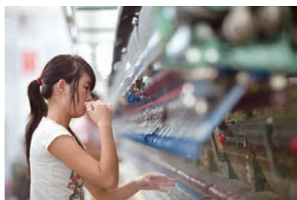
■ 黔江打造繭絲綢100億產業集群。

城市集聚發展區是黔江重點開發的主戰場，擔負着產城融合發展的重任，為此，該區借機全面實施「城市東進」和「工業強區」戰略，唱響了新功能、新起點、新發展的進軍號角。