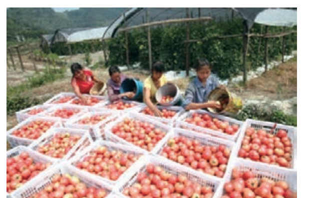
■ 黔江仰頭山現代農業園。

此外，黔江區根據戰略部署，依托區域資源優勢，着力發展城郊型農業。在城周1小時車程範圍內，大力發展設施農業、觀光農業。形成了中塘一小南海、金溪—石家、沙壩—石會、馮家—阿蓬江4條休閒觀光農業路線，每逢節假日，人流如潮，效益可觀。以黔江城區為圓心，中塘、沙壩、水田、馮家等鎮鄉為半徑，一個微縮的生態農業經濟圈正在形成。