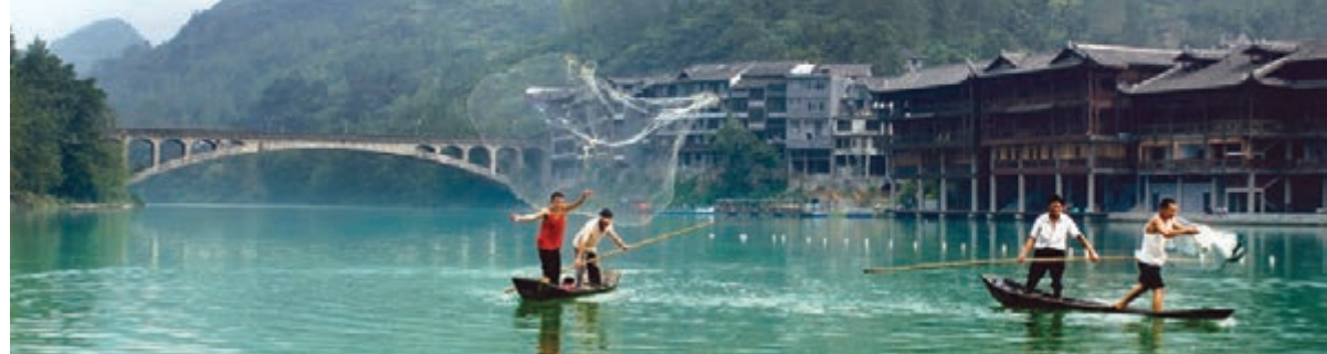
■ 阿蓬江畔的濯水古鎮。

仙山；有清幽原始的阿蓬江神龜峽和官渡峽；有古色古香的濯水古鎮和蒲花暗河；有南溪驢子、向氏武術等一批國家級、市級非物質文化遺產，民族文