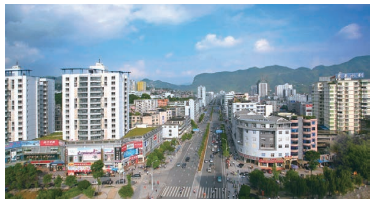
■ 被譽為重慶最美街道的黔江新華大道。

水田村東接正陽，南鄰馮家，自然資源豐富，於是他們一邊竭力爭取建立工業企業轉移承接服務基地，一邊充分發揮煤礦、石材等項目的示範效應，利用礦產資源豐富的優勢，加大策舉引風力度，致力於特色工業園的崛起。力爭在2016年，全鄉工業總產值實現超億元目標，農民人均純收入保持22%的增長率。