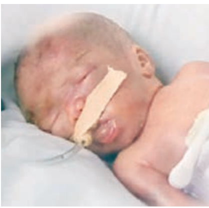
相信是中國胎齡最小的「巴掌嬰兒」。