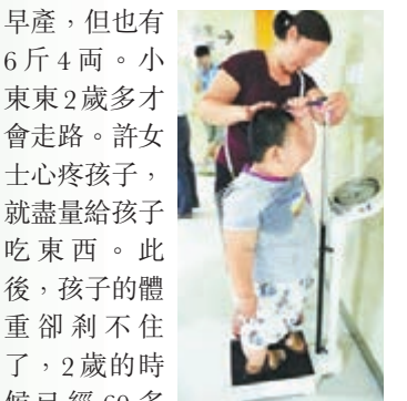
小東東體重達100斤。網上圖片